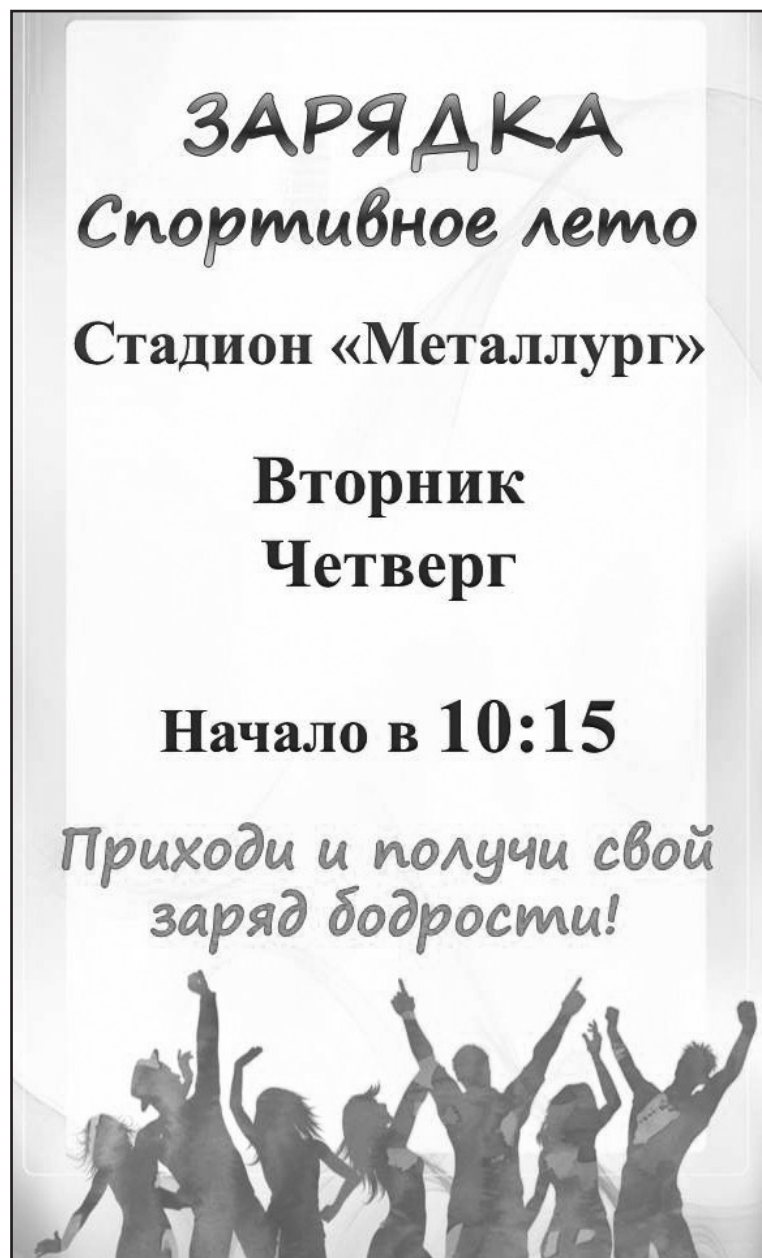
Страницы подготовила Карина Шишкина