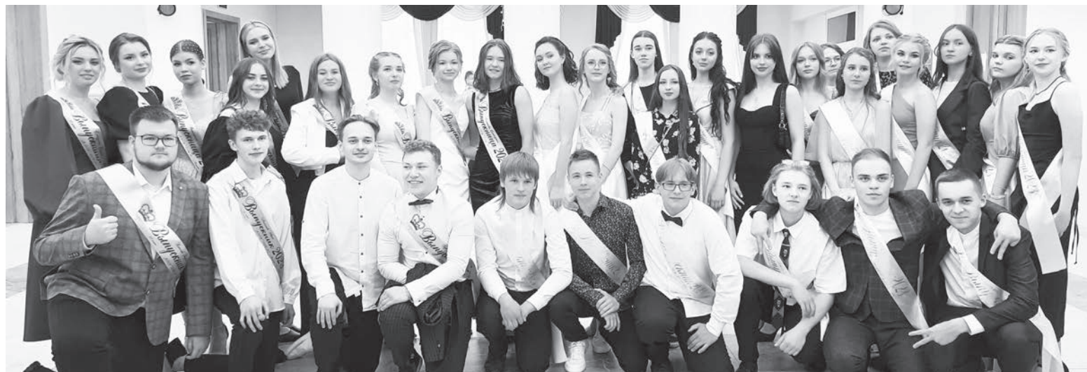
Во Дворце Культуры для выпускников 11 классов школ города Пикалёво состоялся выпускной бал.

Уважаемые гости, взволнованные учителя и родители, поздравления, благодарности, пожелания, цветы, шары, последний школьный вальс, слёзы и улыбки — вот такая особая атмосфера царил в этот летний июньский день.