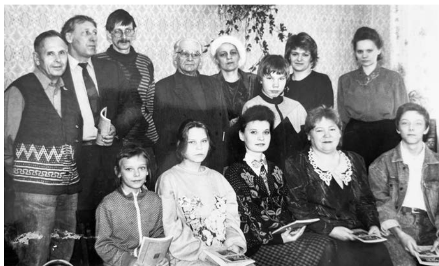
Со своей первой книгой - «Зарницы над Ряданью» - пикалёвские литераторы на творческой встрече в детском клубе «Алые паруса» (1992 год).