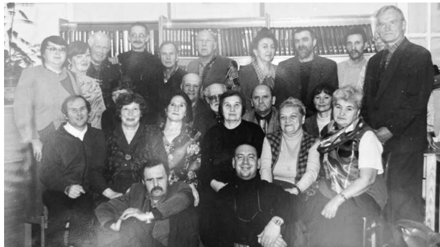
В гостях у литературного объединения «Земляки» - тихвинские поэты. Заседание, посвященное презентации сборника «С этим городом - навек!» (3 октября 2004 года)

Другие тоже дефицитом прельщуют. Один стенку «Кристина» посулил, другой предложил японский цветной телевизор, третий болгарский ковер. Да имей я живого льва, вряд ли даже на «Москвича» обменял бы! Лично мне покой дорожке.