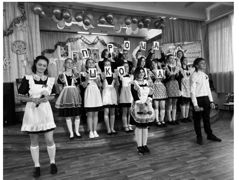
Школа №3, 11-ый класс