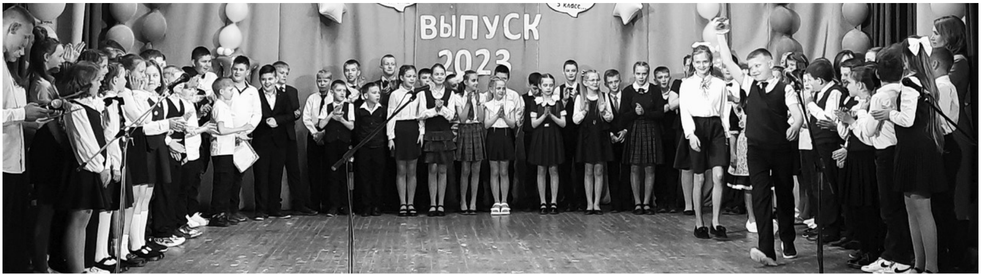
Школа №4, 4-ый класс