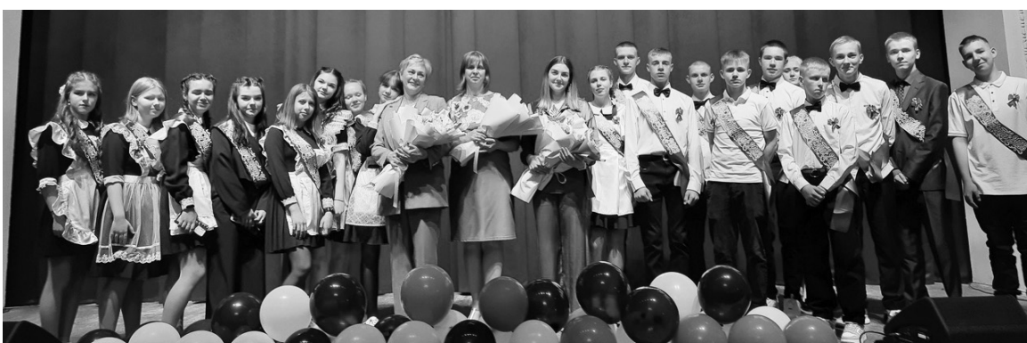
Школа №2, 9-ый класс