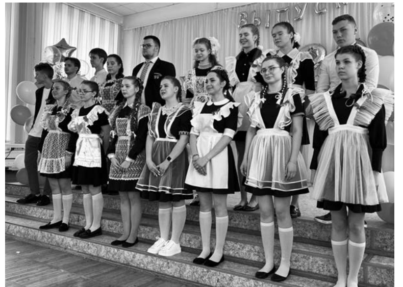
Школа №1, 11-ый класс