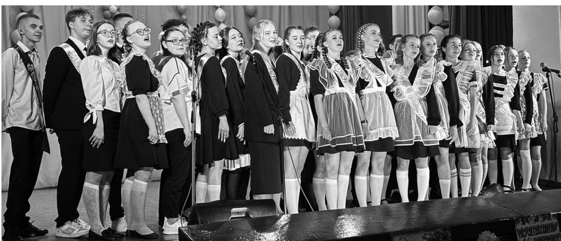
Школа №4, 9-ый класс