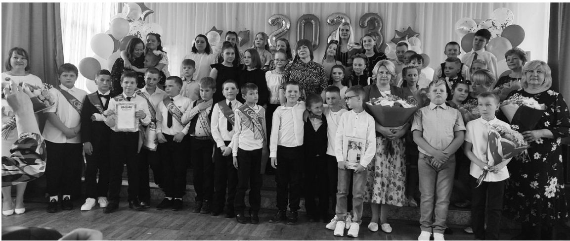
Школа №1, 4-ый класс