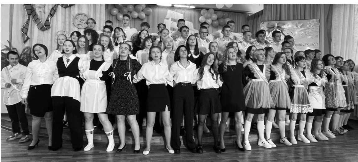
Школа №3, 9-ый класс