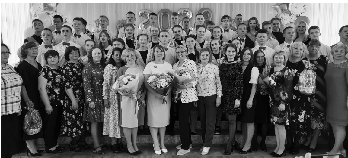
Школа №1, 9-ый класс