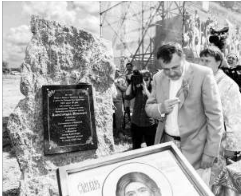
На торжестве в честь 775-летия победы русской дружины над шведами

Много веков спустя очередной западный завоеватель – Адольф Гитлер тоже стремился уничтожить наши духовные основы – оставшимся в живых немногим