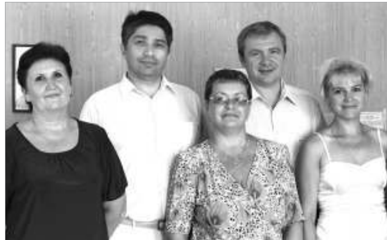
Коллектив редакции с главой администрации МО «Город Пикалёво» Сергеем Вебером и депутатом Госдумы Сергеем Петровым. Июль 2010 г.