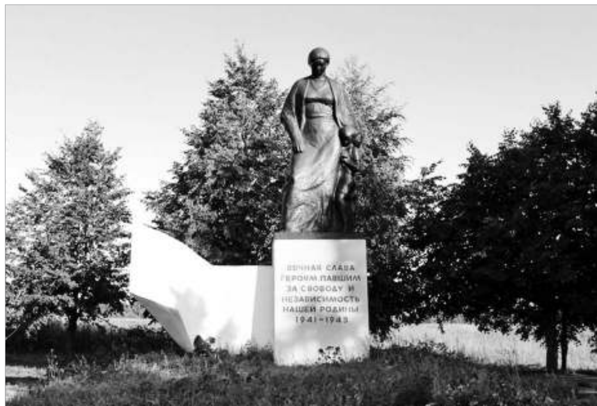
Братское захоронение в д. Кондакопшино