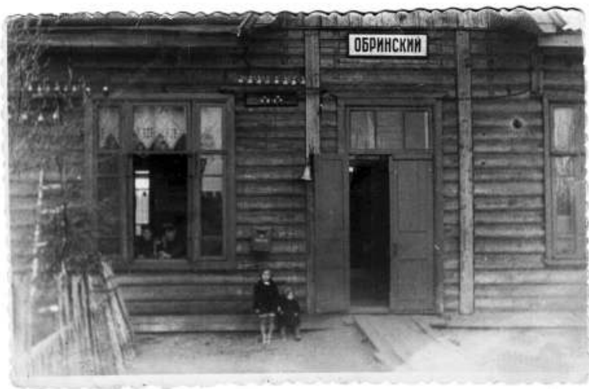
Железнодорожный вокзал «Обринский»