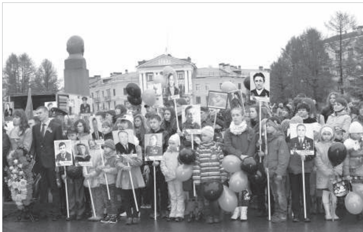
Бессмертный полк в Пикалёве 9 мая 2014 г.

«Стена памяти» будет размещена в дни празднования Дня Победы на центральной площади города. Каждого ветерана в День Победы вспомнит не только его семья, но и весь наш город!