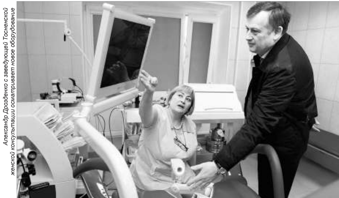
Александр Дрозденко с заведующей Тосненской женской консультации осматривает новое оборудование

цию, не понадобятся. Более того, с 1 апреля проезд в электричке уменьшен с 2 рублей 65 копеек до 2 рублей 40 копеек. Но это не значит, что мы должны успокоиться.