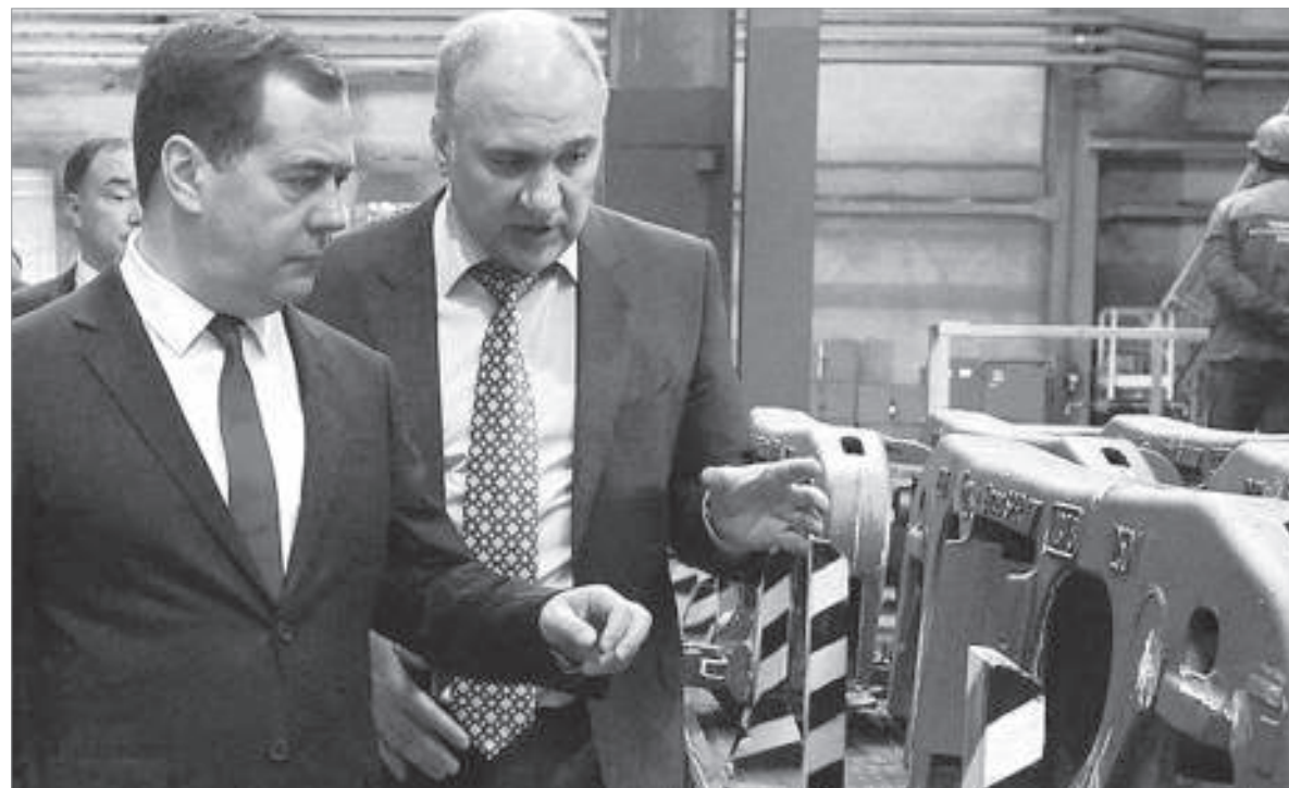
Дмитрий Медведев осматривает производственные цеха и образцы готовой продукции ЗАО «Тихвинский вагоностроительный завод»

Дмитрий Медведев также перечислил основные проблемы отрасли.