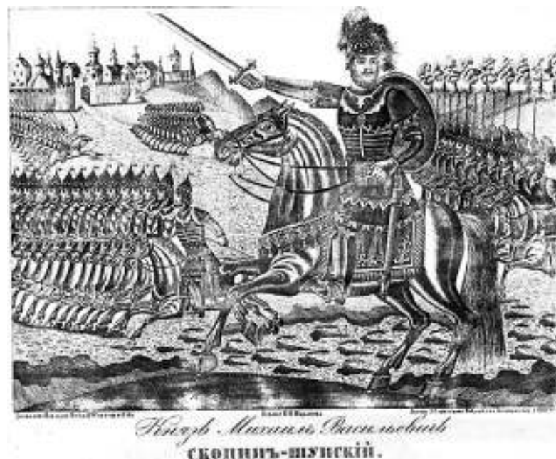
Князь Михаил Васильевич Скопин-Шуйский. Литография 1876 г.