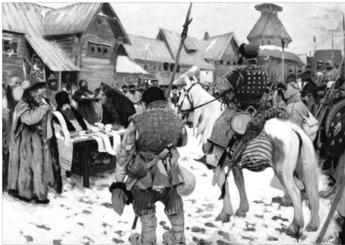
С.В. Иванов. Смотр служилых людей (XVI-XVII вв.). 1908 г.

Общий поместный оклад Прохора Кулибакина увеличился до 400 четвертей, и возросла денежная придача, выдаваемая периодически. Но возвратившись в новгородские земли помещики, участвовавшие в борьбе с восставшими под руководством И. Болотникова, ничего не получили. Местные власти не имели указаний по данному вопросу от центральных властей, которые были ввязаны в новую междоусобицу