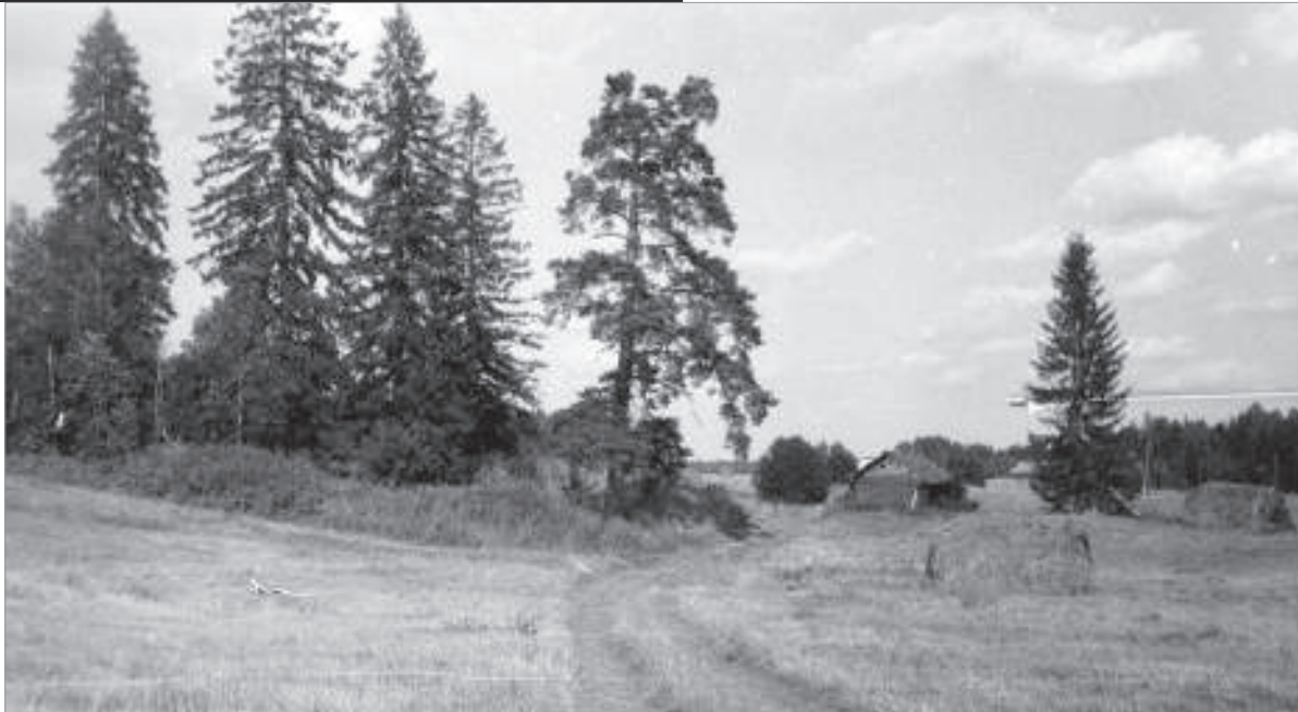
Деревня Дуброва. Фото 1970-х гг.