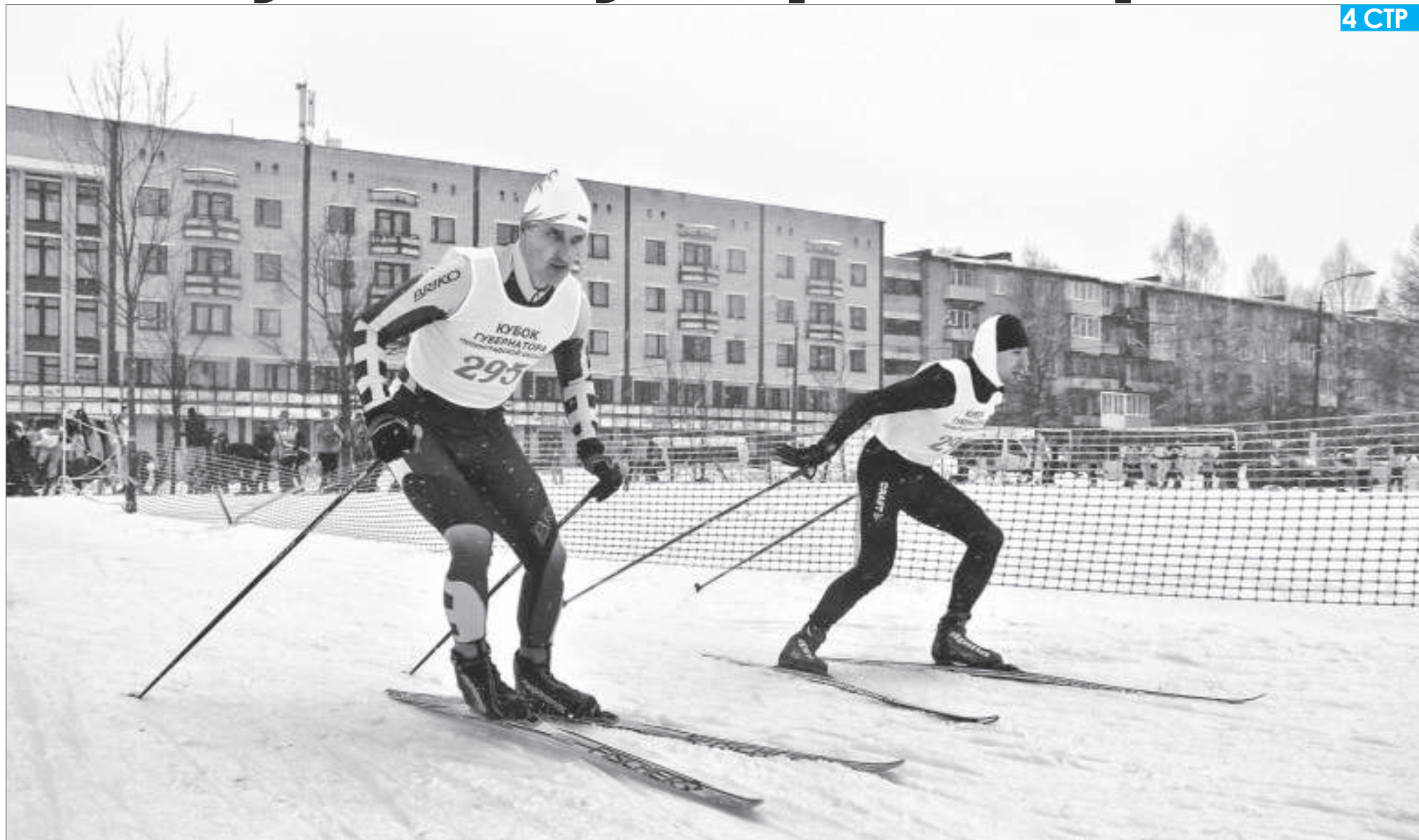
На прошедшей неделе в Пикалёве прошли два больших спортивных мероприятия – открытый турнир г. Пикалёво по гандболу и первый этап кубка губернатора Ленинградской области по лыжным гонкам в зимнем сезоне 2014-2015 гг.