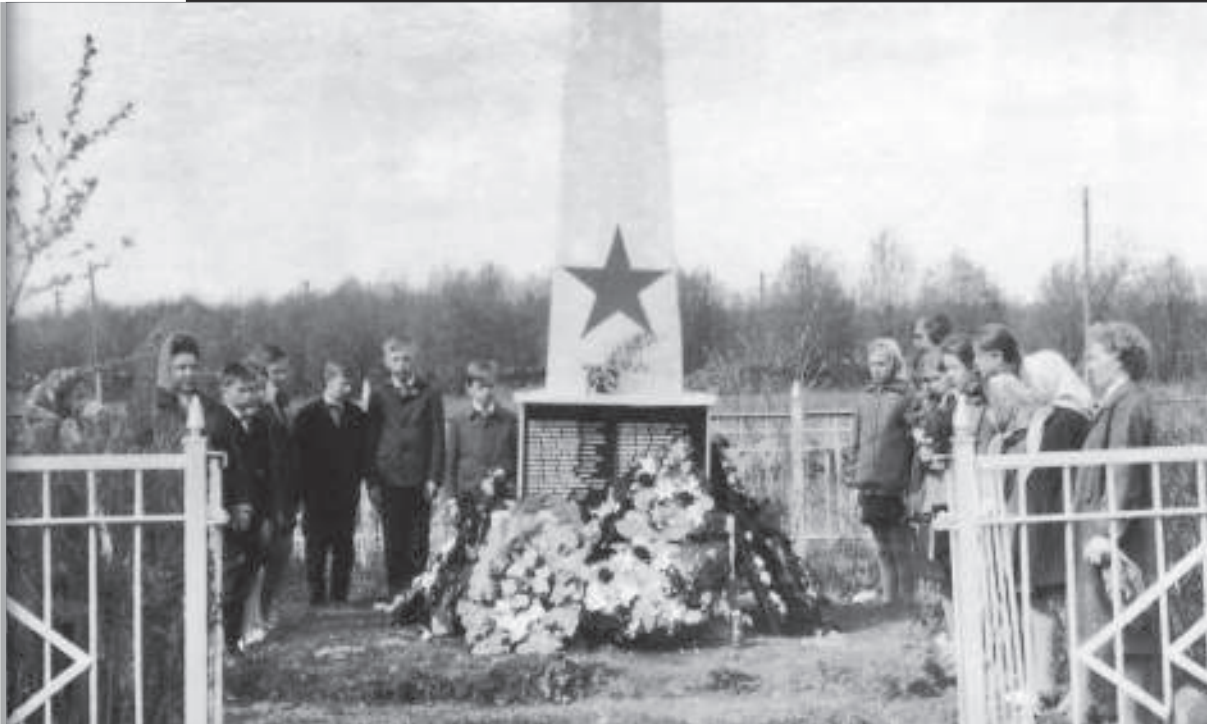
Учащиеся Новодеревенской школы у братской могилы в д. Зиновья Гора. Фото начала 1970-х г.г.