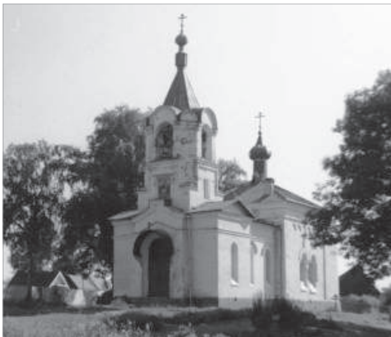
Троицкая Сенновская церковь. 1898 г. Современное фото.