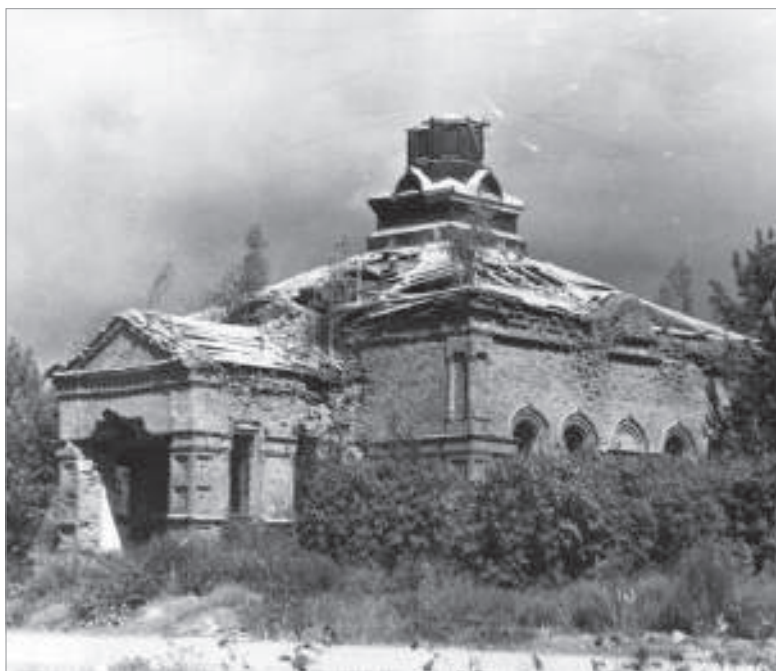
Воскресенская Лученская церковь (Пикалёво). Фото 1970-е гг.

Назначенный в 1896 году новый священник Севериан Николаев возобновил строительство каменной церкви, которая была освящена 17 мая 1898 года. Накануне днём на колокольню церкви был поднят колокол весом 40 пудов 13 фунтов (660,5 кг). На освящении храма присутствова-