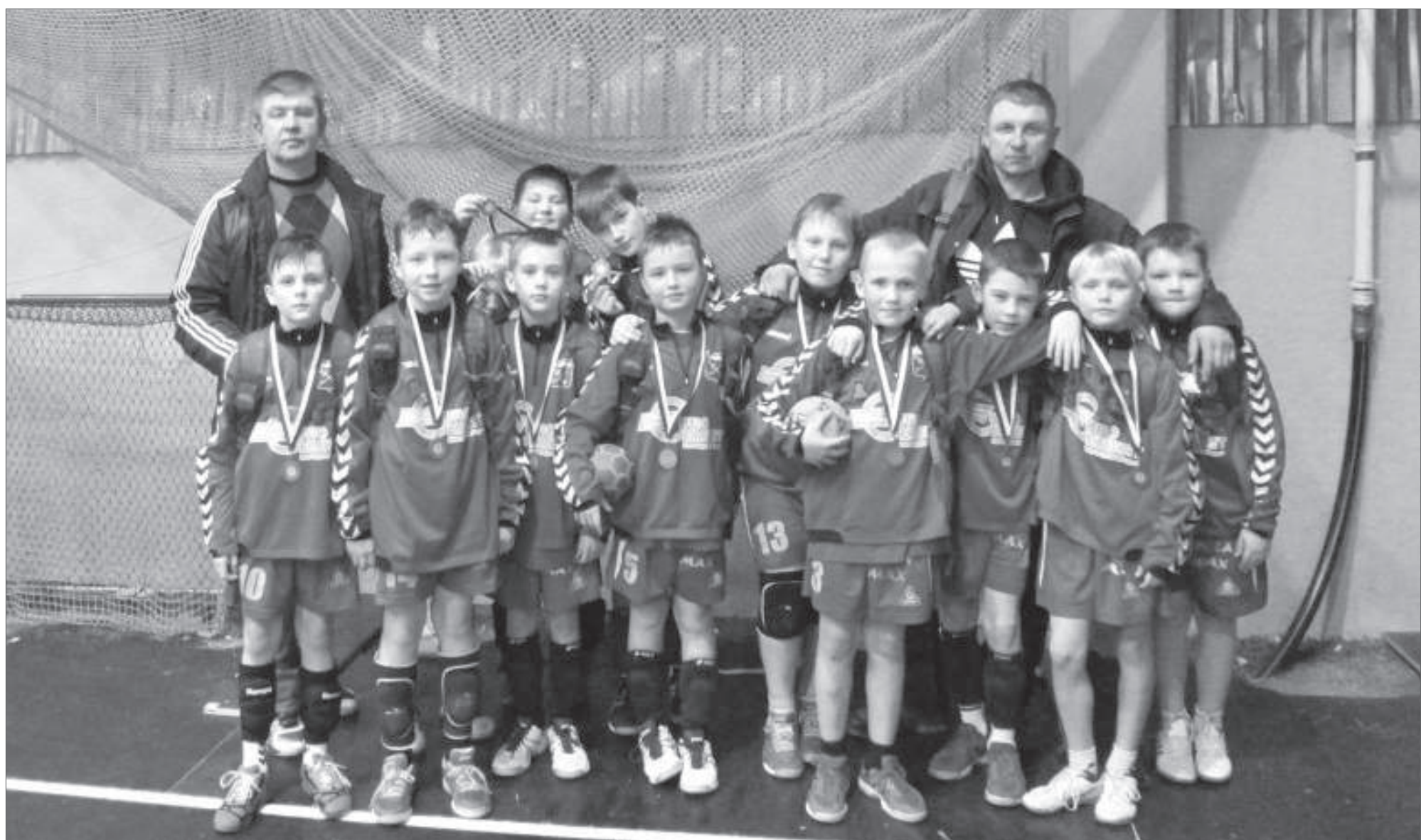
Команда гандболистов (тренер А.Ю. Амосов) в очередной раз вернулась с победой. На международных соревнованиях XXII Aktia Cup Vantaa в Финляндии пикалёвцы стали единственными призёрами из Ленобласти среди юношей 2004 года рождения, заняв третье место.