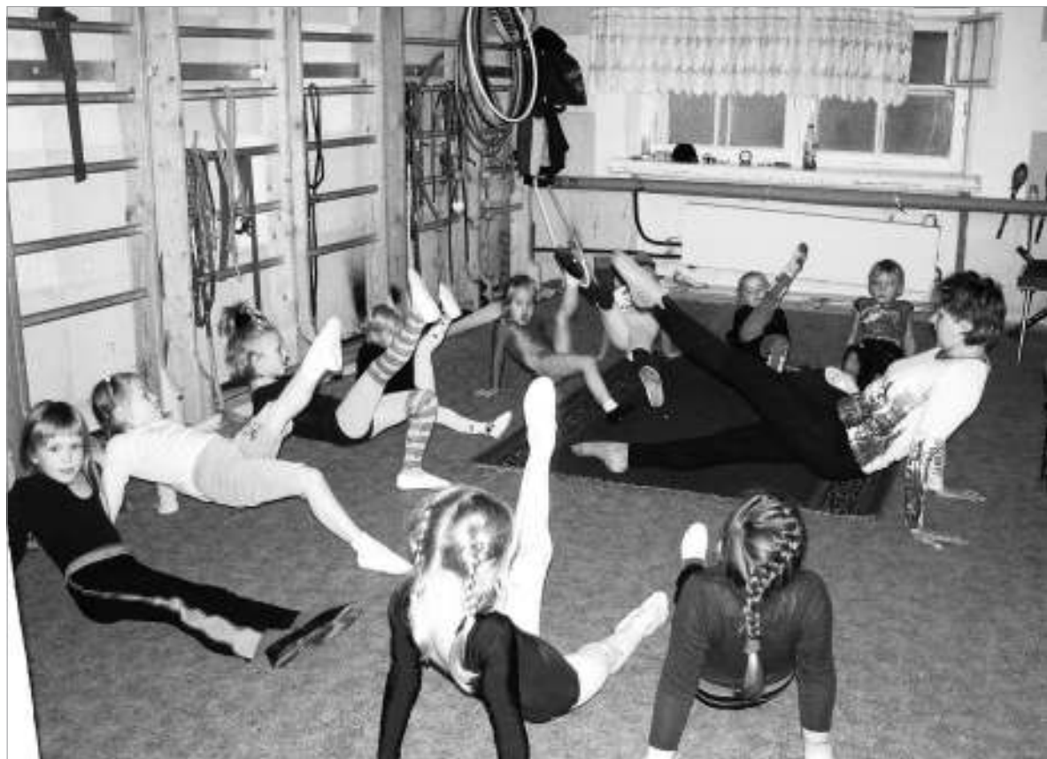
На занятии цирковой студии «Радуга»