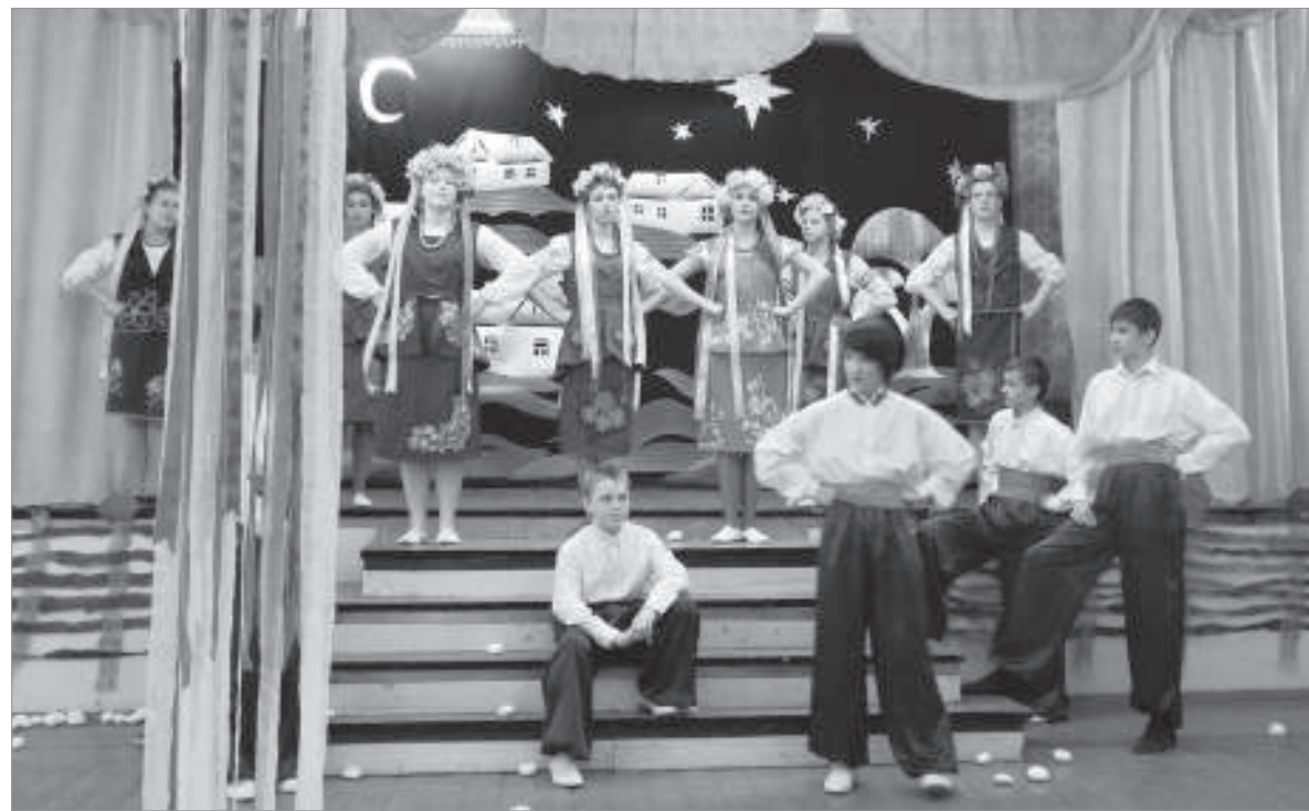
Шестого ноября 2014 года лауреат конкурса «100 лучших школ России» – школа №3 города Пикалёво – отмечает свой полувековой юбилей. Эта значимая дата не только для самого учебного заведения, но и для жителей нашего города. Сколько детей за эти годы она выучила, сколько талантов вырастила, скольким открыла дорогу в большую жизнь! И не зря она называется «Государство «Счастливое время». Здесь дружный, сплочённый коллектив, который постоянно развивает свою школу, делает её лучше и красивее. Многие уже сделано, многие ещё предстоит сделать.

шим желанием и энтузиазмом занимаются в театре: танцуют, поют, читают стихи, сами делают декорации и костюмы. Вместе с детьми поставлено несколько спектаклей: по мотивам сказки С.Я. Маршака «Двенадцать месяцев», пьеса Леонида Филатова «Сказ про Федота-стрельца, удалого молодца», а в мае этого года был показан спектакль по мотивам произведения Н.В. Гоголя «Вечера на хуторе близ Диканьки». Постановка участвовала в фестивале социокультурной просветительской программы «Сказочный мир», который реали-