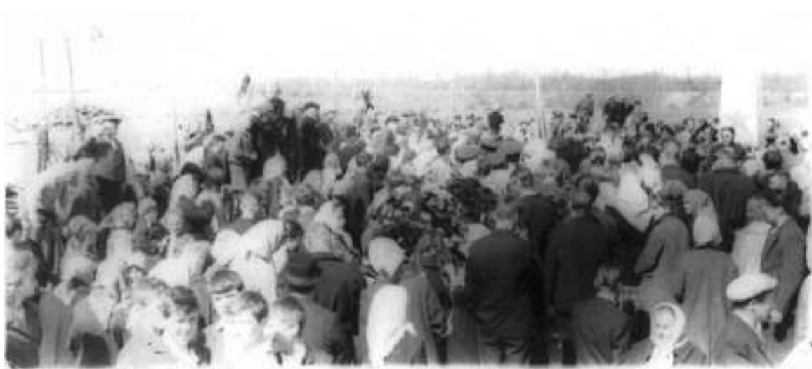
Торжественный митинг на братском захоронении ст. Пикалёво. Начало 1960-х (?) годов

Исполком сельсовета размещался в деревянном доме около вокзала железнодорожной станции Пикалёво-1. Одну комнату занимал председатель, другую – секретарь и бухгалтер, две комнаты были отведены под