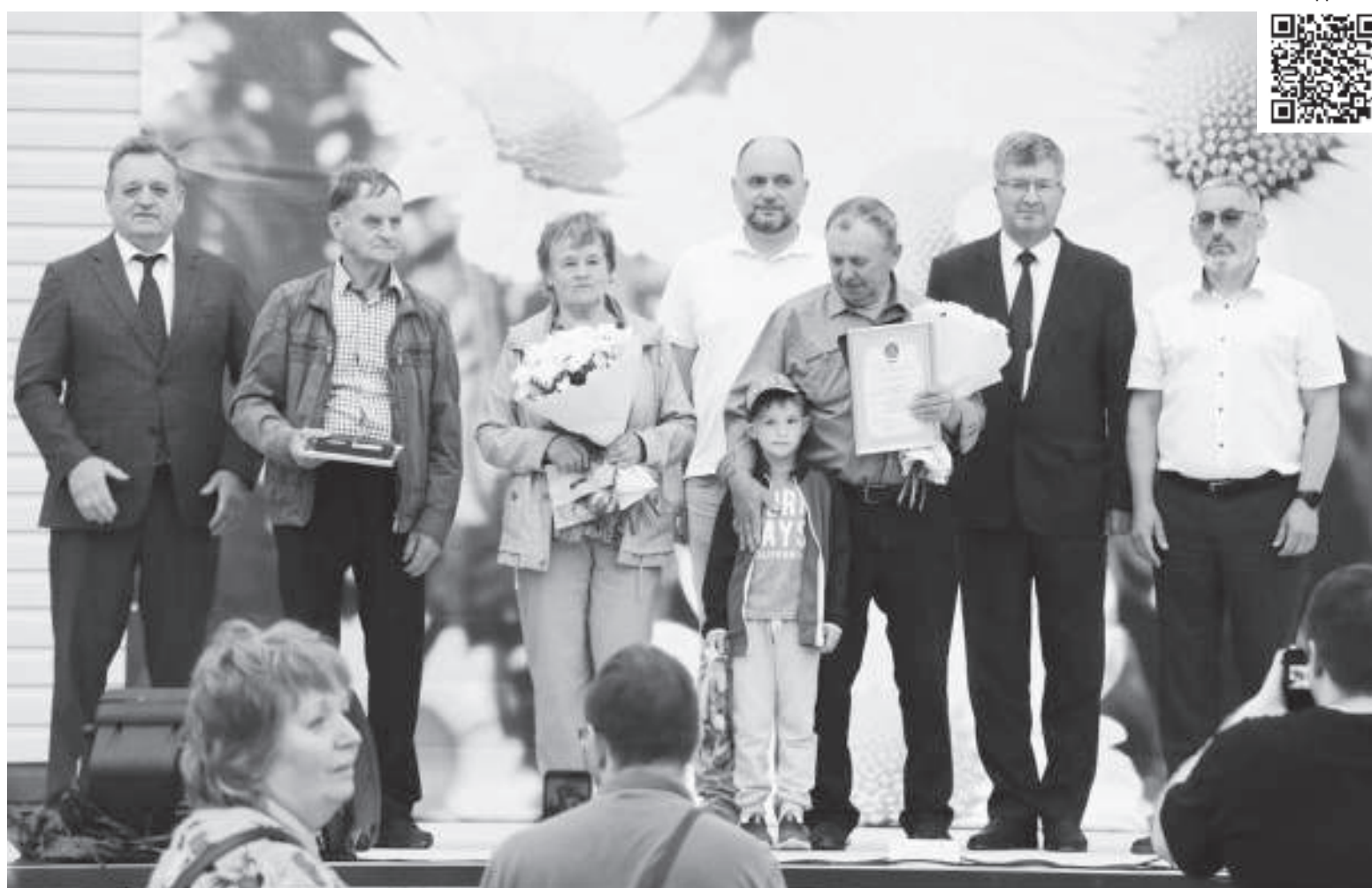
В поселке Совхозном состоялся праздник, посвящённый Дню семьи, любви и верности.