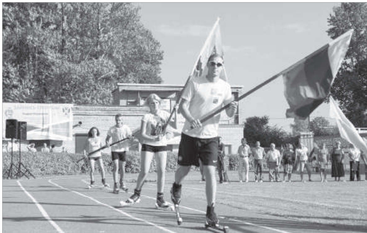
Открытие спортивного праздника «Мы выбираем спорт!»

На стадионе «Металлург» комплексной спортивной базы физкультурно-оздоровительного комплекса Пикалёво 7 августа прошёл спортивный праздник «Мы выбираем спорт!», посвящённый Дню физкультурника и 50-летию стадиона «Металлург». Проведение такого знакового праздника не оценимо как для взрослого населения, так и для подрастающего поколения.