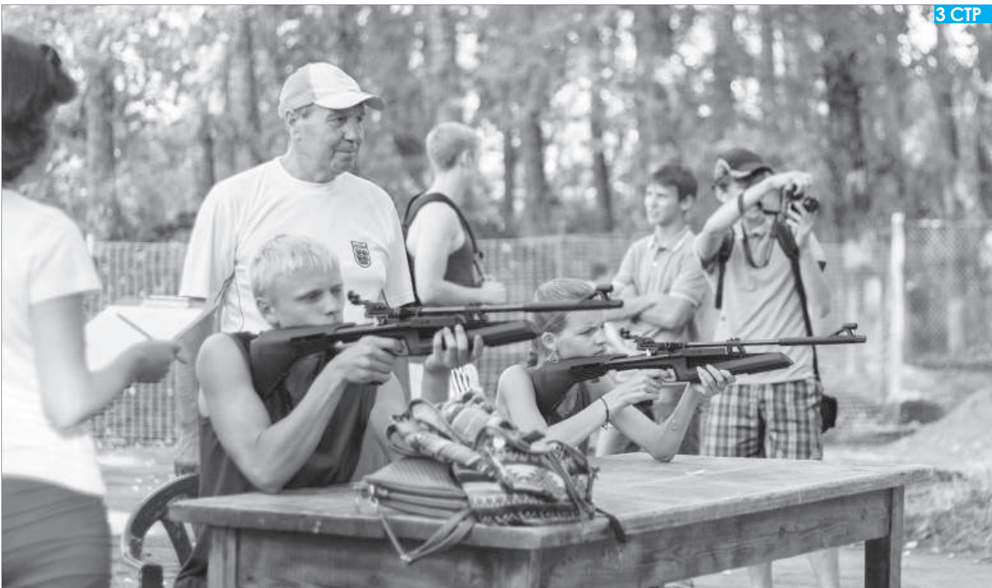
На стадионе «Металлург» комплексной спортивной базы физкультурно-оздоровительного комплекса Пикалёво 7 августа прошёл спортивный праздник «Мы выбираем спорт!», посвящённый Дню физкультурника и 50-летию стадиона «Металлург».