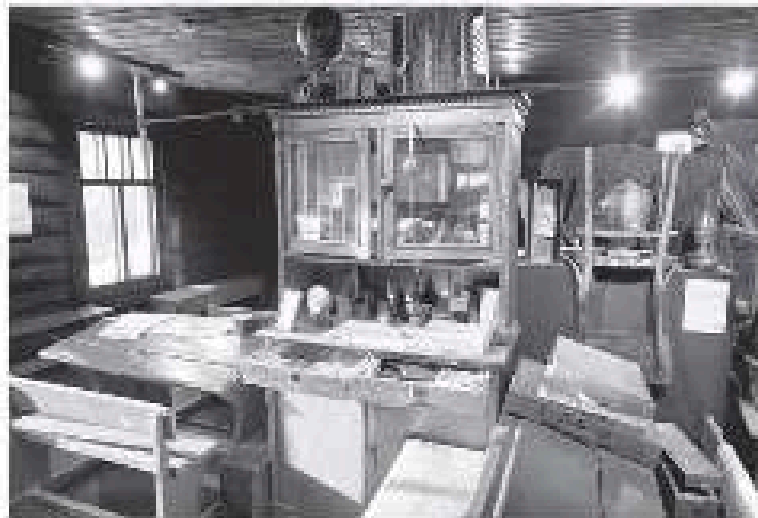
Шольные пары, мебель и старый самовар – все эти вещи из 40-х годов хранят свою память о событиях военных лет

ОТКРЫТЫЙ ПОСЛЕ РЕКОНСТРУКЦИИ МУЗЕЙ «АСТРАЧА, 1941» ЖДЁТ ГОСТЕЙ НА НОВУЮ ЭКСПОЗИЦИЮ О ВЕЛИКОЙ ОТЕЧЕСТВЕННОЙ ВОЙНЕ