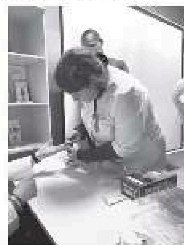
ПУТИ ЗАРАЖЕНИЯ ВИЧ ЛЕНИНГРАДСКАЯ ОБЛАСТЬ, 2022 ГОД

— Чем раньше человек узнает о своей болезни, тем выше шанс сохранить здоровье и жизнь. К нам недавно обратился 37-летний мужчина, который понял, что мог заразиться вирусом от своей девушки. Пациент сдал тест и получил положительный результат. Сейчас его жизни ничто не угрожает, потому что он оперативно начал