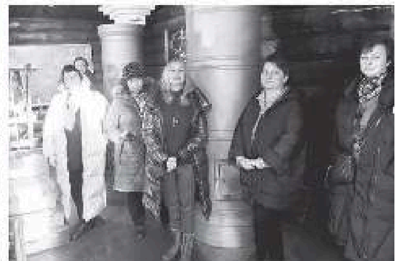
Воскресенье по новой экспозиции посетители не имеют права