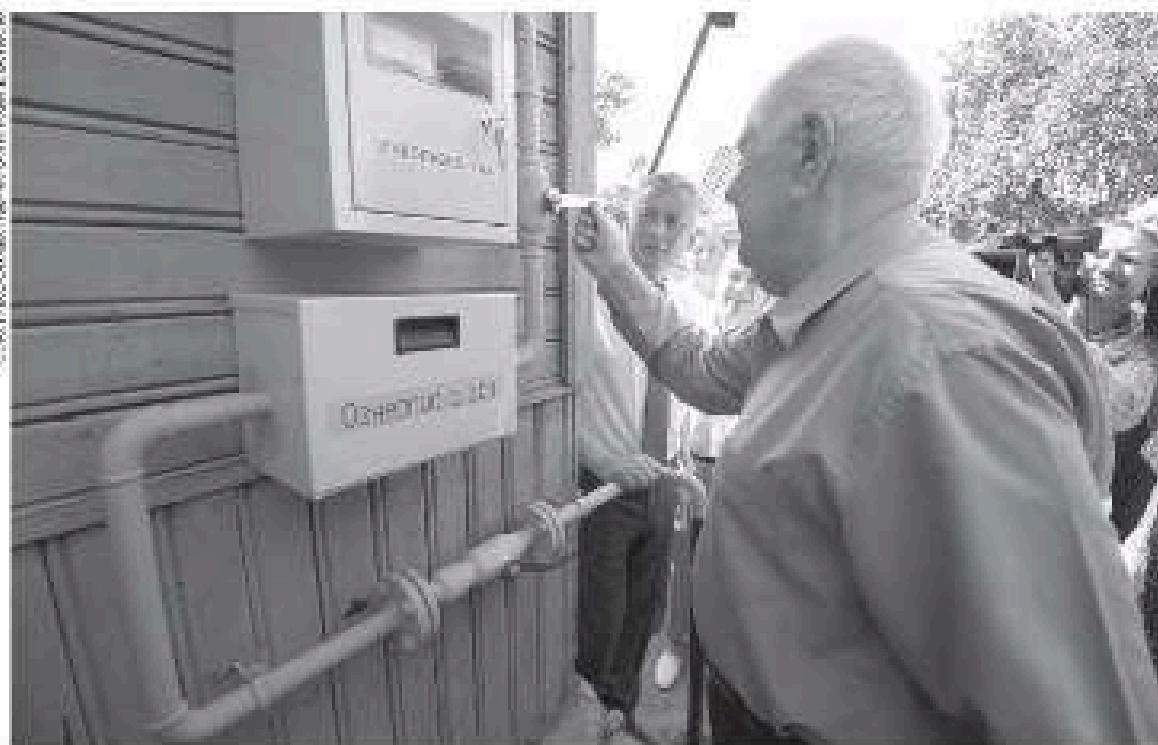
Область субсидирует расходы на проведение работ по догазификации в границах земельного участка

Один из главных энергетических трендов Ленобласти в последние годы – программа газификации домовладений. Это бесплатное подведение газа к земельным участкам за счёт ПАО «Газпром». Людям остается