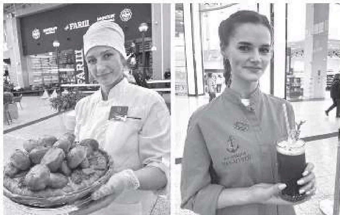
Все блюда на конкурсе были приготовлены из продуктов, выращенных в регионе

Сама Арина осваивает профессию по учебникам и роликам в Интернете. Поддержку таких самородков качествен-