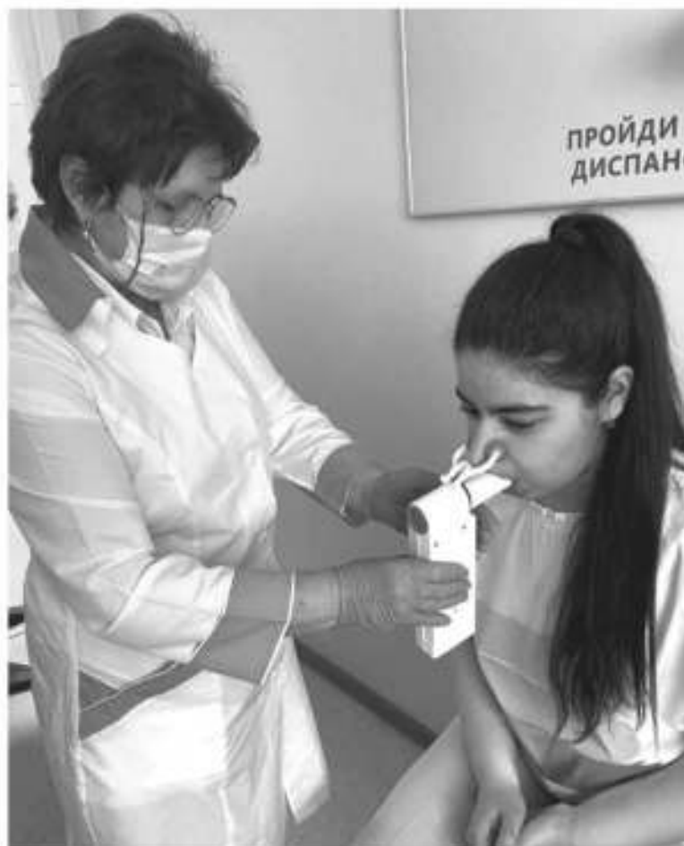
Спирометрия позволяет оценить состояние лёгких после коронавируса

– А как обстоят дела с диспансеризацией? Она ведь особенно важна для перенёсших COVID-19?