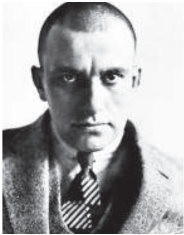
Владимир Маяковский (19.07.1893 – 14.04.1929)