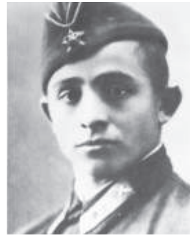
Борис Корнилов (29.07.1907 – 20.02.1938)