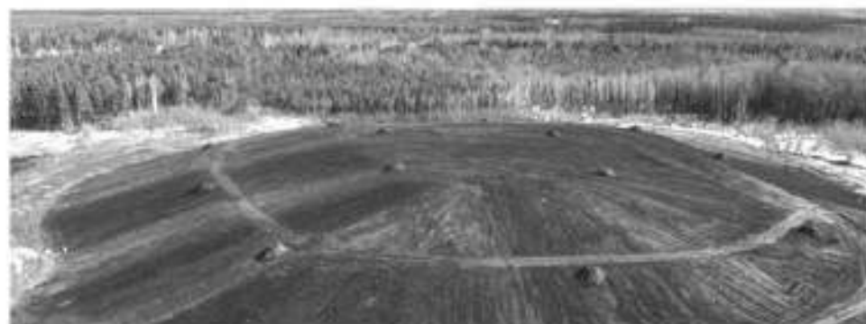
В марте 2022 г. завершена рекультивация 40-летней свалки под Сосновым Бором

За прошедший год в регионе ликвидировано более двух тысяч лесных и дорожных свалок, закрыты два полигона, ликвидирована свалка в Сосновом Бору. Со временем все старые свалки и полигоны смешанных отходов должны быть рекультивированы.