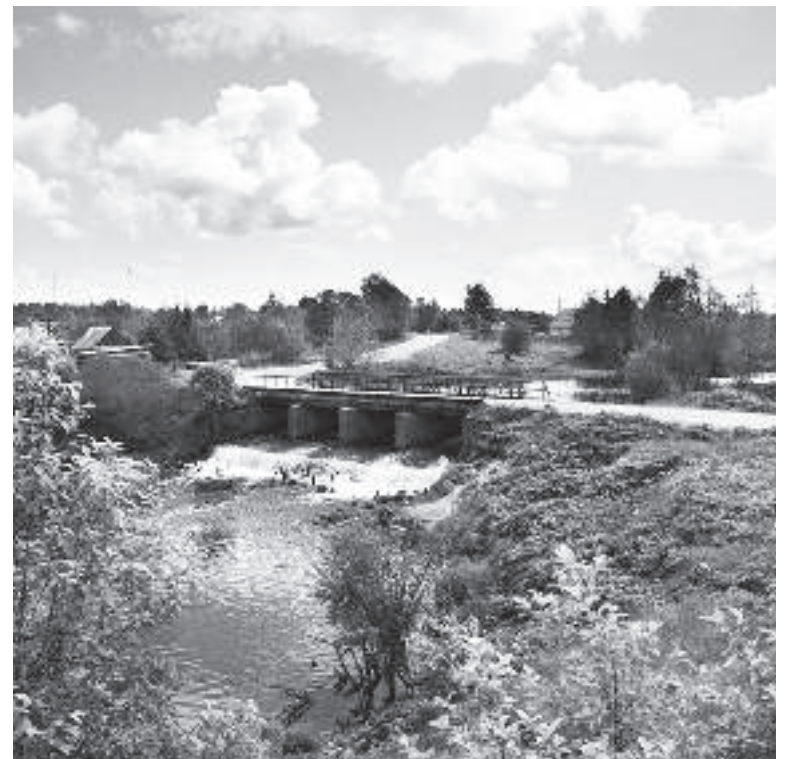
Вид на плотину, наши дни