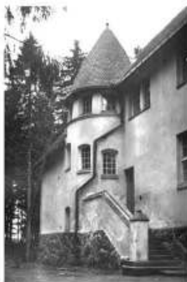
Так выглядела усадьба «Суур-Мерийоки» до Октябрьской революции

В ближайших планах — записать аудиогид и запустить сайт музейного пространства, разработать приложение, которое позволит увидеть историческое здание в виртуальной реальности. Чтобы привлечь внимание к уникальной флоре, активисты мечтают организовать в парке экотропу. На лето 2022 года здесь запланирован фестиваль «Утраченные усадьбы Выборга».