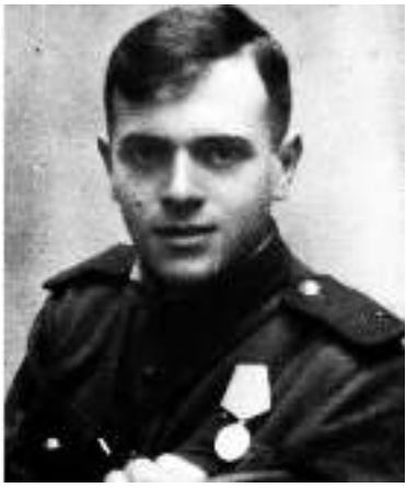
Давид Самойлов (Кауфман) (1.06.1920 – 23.02.1990)