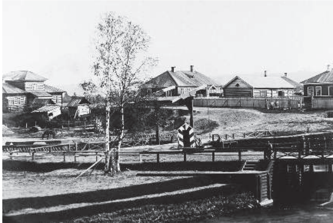
Вид на Шлиссельбургскую плотину и шлюз, в центре на втором плане - дом начальника дистанции