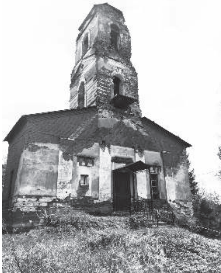
Храм Архангела Михаила, наши дни

Но, в 2008 году силами местных жителей, дачников и просто неравнодушных людей началась реставрация церкви. Сейчас некоторые части церкви уже восстановлены: отремонтирована крыша колокольни с крестом и одно крыло храма, оборудована молельная комната и так далее. Несмотря на все еще плачевный внешний вид храма, местные не опускают рук и продолжают реставрацию своими силами. Они говорят: «В таких храмах особенно понимаешь слова Господни: «сила Моя совершается в немощи». В таких руинах часто бывает больше благодати, нежели в вызолоченных куполах...»