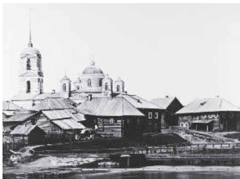
Вид на Храм Архангела Михаила и плотину, архивное фото