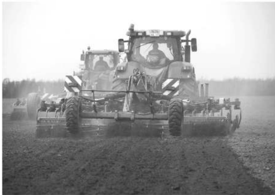
За счёт стабильного финансирования из федерального и регионального бюджетов область спокойно вошла в посевную

ПОСЕВНАЯ В ЛЕНОБЛАСТИ ИДЁТ ПО ПЛАНУ, А ЭТО ЗНАЧИТ, ЧТО ХОЗЯЙКИ РЕГИОНА СМОГУТ ПРИГОТОВИТЬ НЕ ТОЛЬКО БОРЩ, НО И ДРУГИЕ БЛЮДА ИЗ ОВОЩЕЙ, ВЫРАЩЕННЫХ НА ПОЛЯХ РЕГИОНА