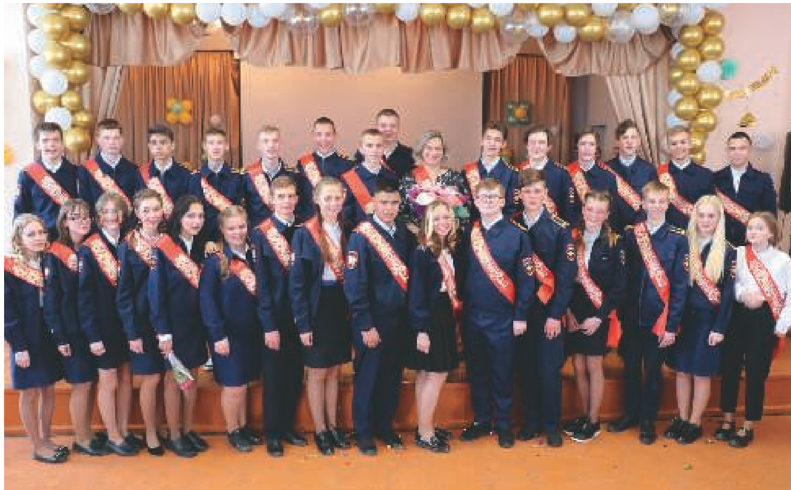
Выпускники 9 класса школы №4