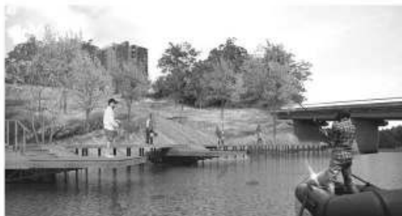
Варианты благоустройства набережной реки Луга вдоль улицы Победы предполагают создание необычных прогулочных троп прямо над водой