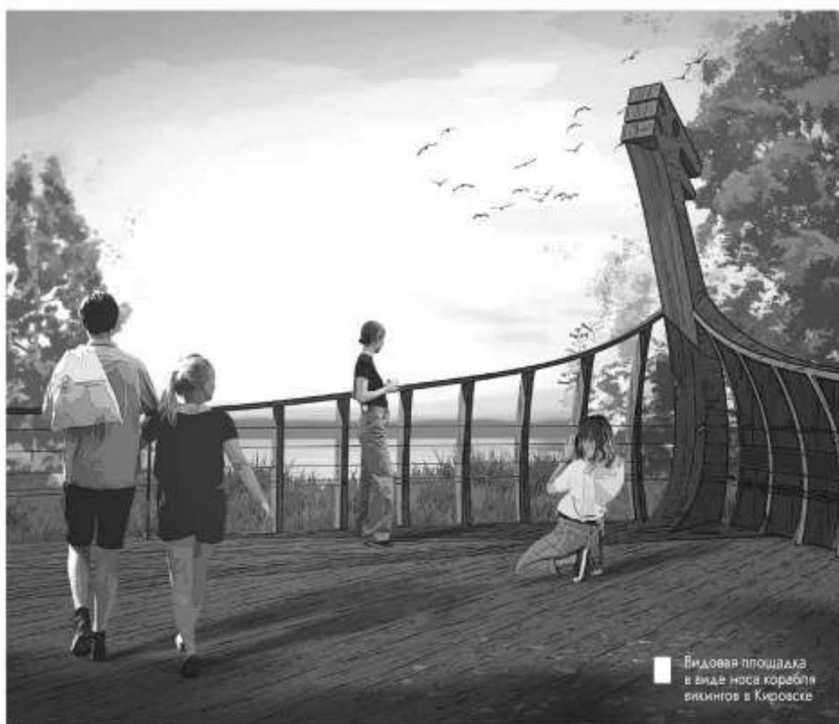
Видовая площадка в виде носа корабля викингов в Кировске

Всего в проекте участвуют 29 населённых пунктов из Ленинградской области. Уже через год результаты голосования воплотятся в реальные проекты, которые сделают жизнь этих мест более комфортной и современной. Поддержанные ленинградцами