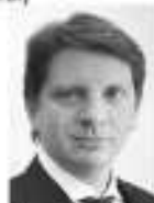
ЕВГЕНИЙ БАРАНОВСКИЙ, ЗАМЕСТИТЕЛЬ ПРЕДСЕДАТЕЛЯ ПРАВИТЕЛЬСТВА ЛЕНИНГРАДСКОЙ ОБЛАСТИ ПО СТРОИТЕЛЬСТВУ И ЖЖ

Дизайн-проекты благоустройства для 29 общественных пространств — парков, набережных, многофункциональных спортивных и игровых зон — это серьёзные проекты, разработанные с учётом предложений жителей. Их много, все качественные, и голосование позволит определить лучшие. Я всегда говорил, что концепции благоустройства нужно создавать в тесном сотрудничестве с местными жителями. Только так удастся выпускать проекты, которые максимально соответствуют запросам населения.