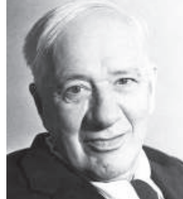
Корней Чуковский (31.03.1882 - 28.10.1969)

разбивая в пыль и брызги изумрудные громады. - Буревестник с криком реет, черной молнии подобный, как стрела пронзает тучи, пену волн крылом срывает. - Вот он носится, как демон, гордый, черный демон бури, и смеется, и рыдает... Он над тучами смеется, он от радости рыдает! - В гнев гнома, чуткий демон, он давно усталость слышит, он уверен, что не скроют тучи солнца; нет, не скроют! - Ветер воет... Гром грохочет... - Синим пламенем пылают стаи туч над бездной моря. Море ловит стрелы молний и в своей пучине гасит. Точно огненные змеи, вьются в море, исчезая, отраженья этих молний! - Буря! Скоро грянет буря! - Это смелый Буревестник гордо реет между молний над ревущим гневно морем; то кричит пророк победы: - Пусть сильнее грянет буря!.. 1901 год