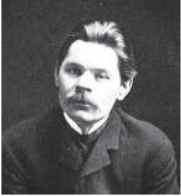
Максим Горький (28.03.1868 - 18.06.1936)