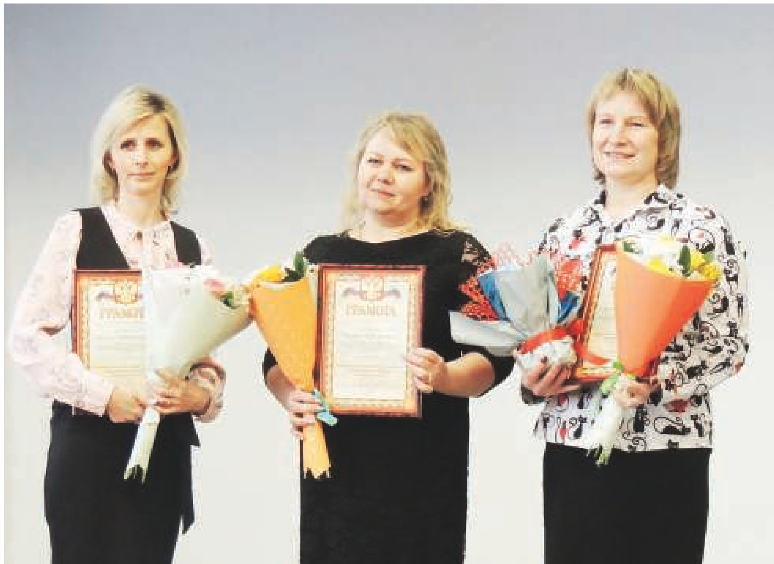
Фото - рубрика на страницах газеты

3 февраля в Бокситогорской школе №1 состоялся финал районного конкурса «Учитель года».