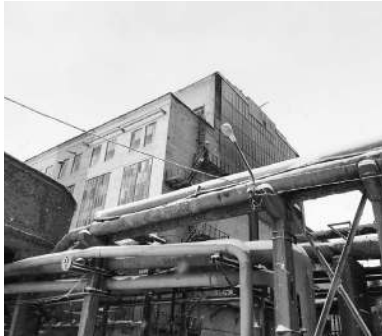
Здание ТЭЦ. Наши дни

«Дорогие мои коллеги, работники и управленческий аппарат! Я от всей души поздравляю вас всех с этим праздником! Желаю всем крепкого здоровья, успехов во всем и всего-всего самого доброго. Хочется также сказать спасибо от лица всех ветеранов нынешним работникам ТЭЦ за внимание и заботу в наш адрес. С наступающим Новым годом и нашим профессиональным праздником!»