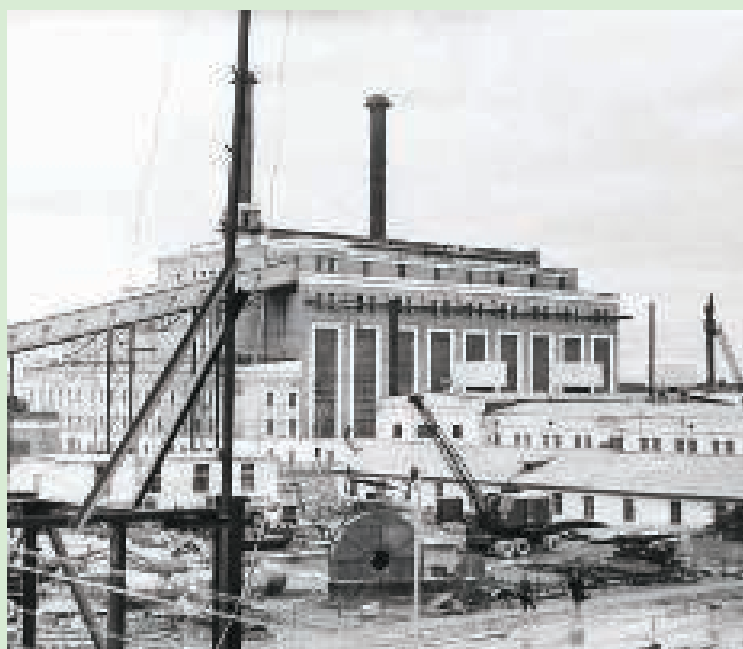
ТЭЦ ПГЗ, 1958 год