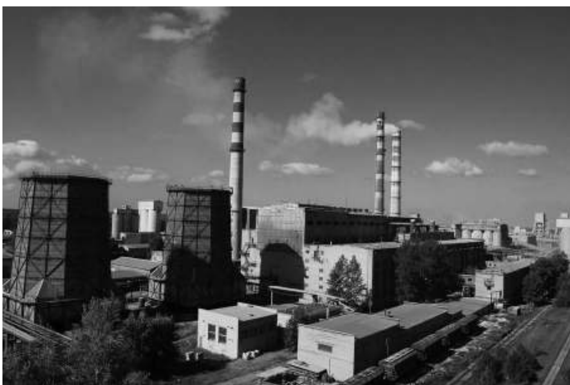
ТЭЦ, 2006 год

«Поздравляю всех бывших и действующих сотрудников ТЭЦ с 65-летием со дня ее пуска! Прежде всего, хочу пожелать здоровья, оптимизма, больших жизненных сил ветеранам, молодежи, которая только пришла работать, благополучия, стабильности в работе, безопасной и безаварийной работы, а руководству – мужества и терпения. Также, хочу поздравить всех с Днем энергетика и приближающимся Новым годом. Всем удачи и здоровья!»