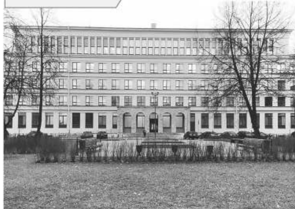
Прокуратура Ленинградской области (Санкт-Петербург, Торжковская ул., 4)

ЗА 11 МЕСЯЦЕВ 2021 ГОДА ПОСТУПИЛО В ПРОКУРАТУРУ ЛЕНИНГРАДСКОЙ ОБЛАСТИ.