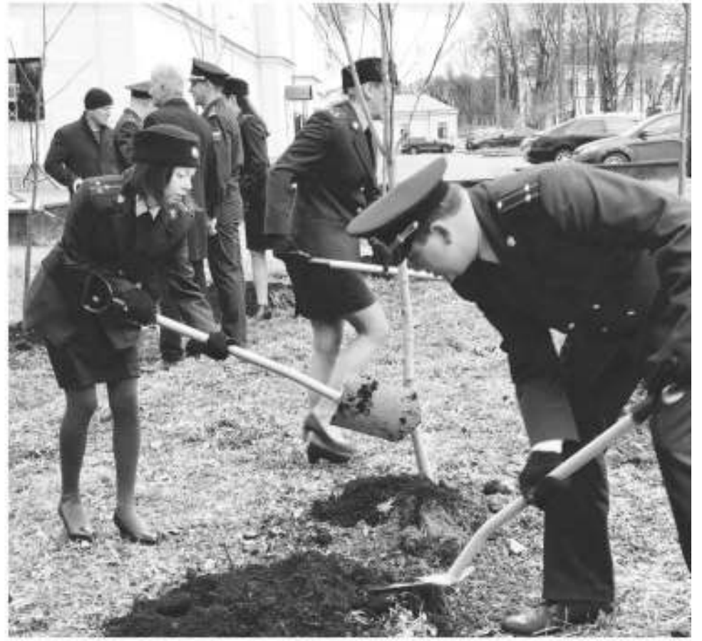
Этой осенью возле Гатчинского Дома культуры к 300-летию создания российской прокуратуры была высажена Аллея героев — 30 лип и кленов

регион обеспечил благоустроенным жильем более 1500 детей, направив на это порядка 3,5 млрд рублей.