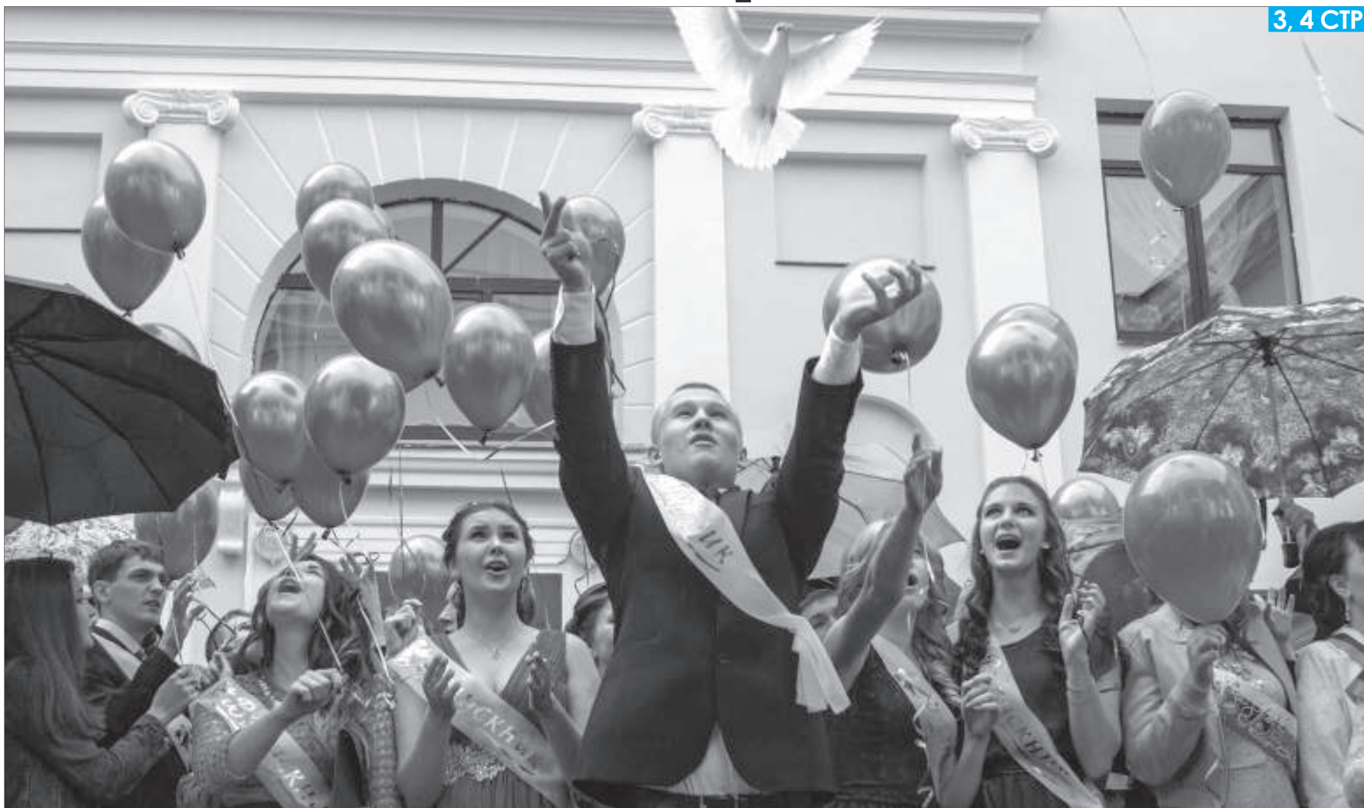
В финале городского праздника, подтверждая символичность названия, главные герои выпускного бала выпустили в небо белых голубей и сине-белые шары как символ успеха, мечты, высоких и чистых помыслов.