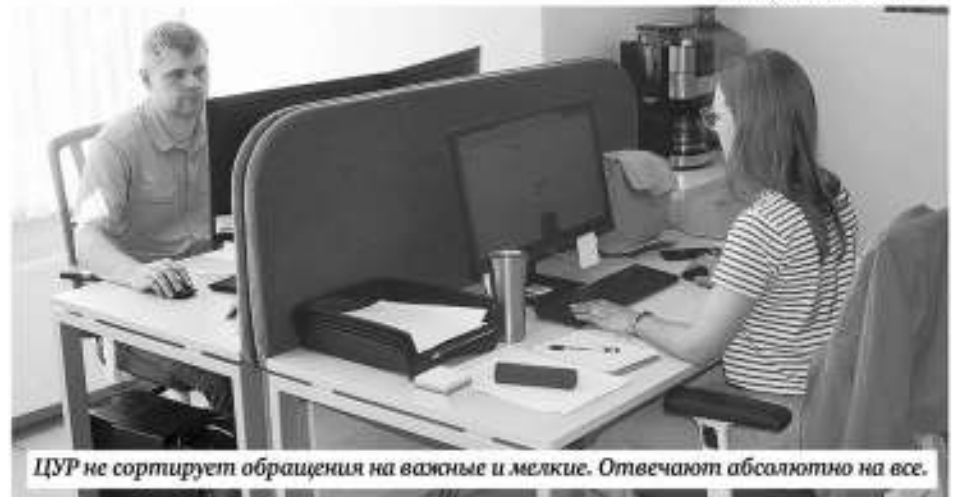
ЦУР не сортирует обращения на важные и мелкие. Отвечают абсолютно на все.

Все обращения структурируют по отраслям и направляют в профильные ведомства.