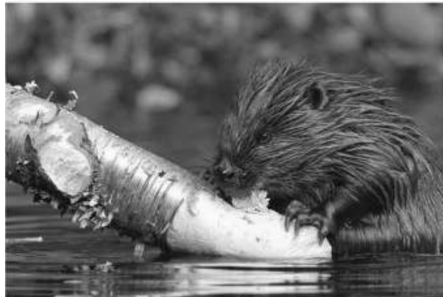
Фото — «Големистки прорыв»

Мы привычно оперируем выражением «братья наши меньшие», подчеркивая некоторое превосходство над животными. Между тем взаимоотношения человека и представителей дикой фауны не так просты.