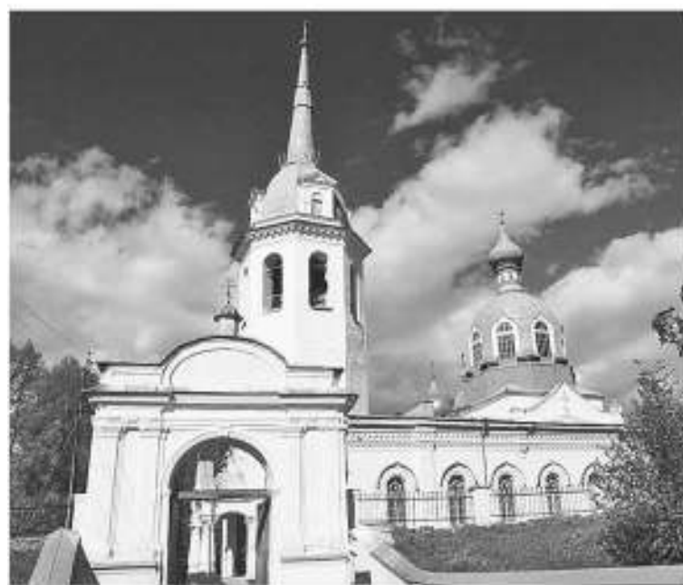
Монастырь в Новой Ладоге