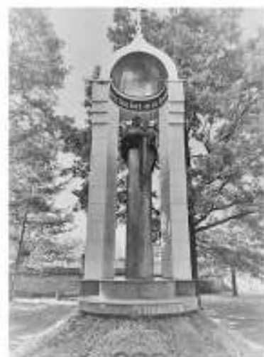
Часовня в память Невской битвы в Усть-Ижоре

В первом же столкновении русские смяли строй шведов. Нескольким смельчакам удалось проникнуть в центр вражеского лагеря, подсесть опору главного шатра, и тот упал. Это подорвало дух противника, и началось бегство. Пророческими оказались слова Александра: «Не в силе Бог, а в правде!»