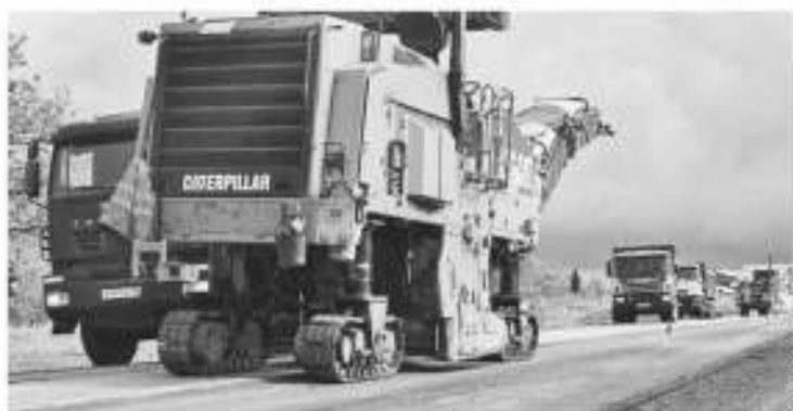
Дорожные работы на региональной трассе Лодейное Поле — Тихтин — Будогощь в Тихтинском районе