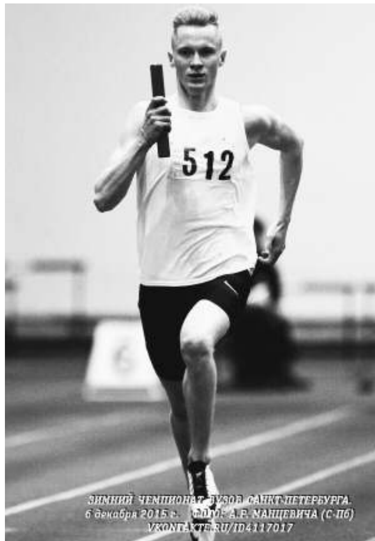
ЗИМНИЙ ЧЕМПИОНАТ ЛУЗОВ САНКТ-ПЕТЕРБУРГА. 6 декабря 2015 г.

– Чтобы победить в соревнованиях, нужно иметь характер, силу