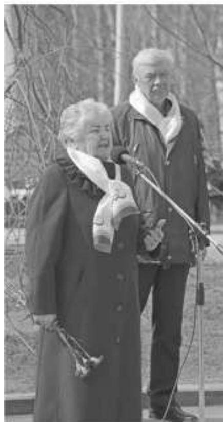
Памятная акция, название которой перекликается с известным стихотворением Юлии Друниной, проводится в Ленинградской области с 1997 года.

Акция «Мы родом не из детства — из войны...» состоялась 13 апреля на десятом километре Дороги жизни, близ памятника «Полуторка».