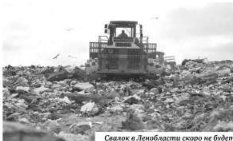
Свалок в Ленобласти скоро не будет