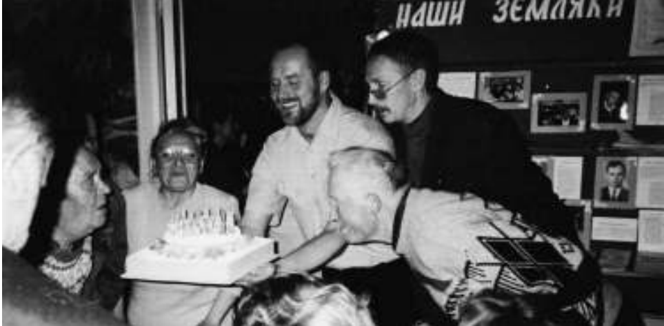
Праздник по случаю юбилея со дня выпуска первого сборника «Зарницы на Ряданью»