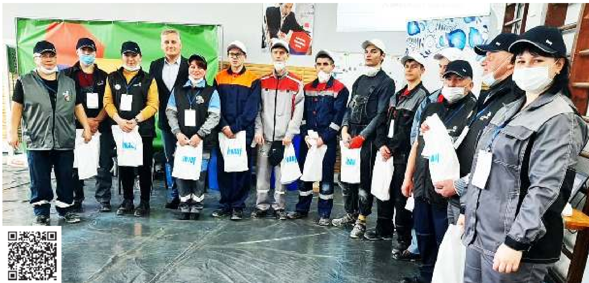
Участники из ГАПОУ ЛО «Борский агропромышленный техникум»