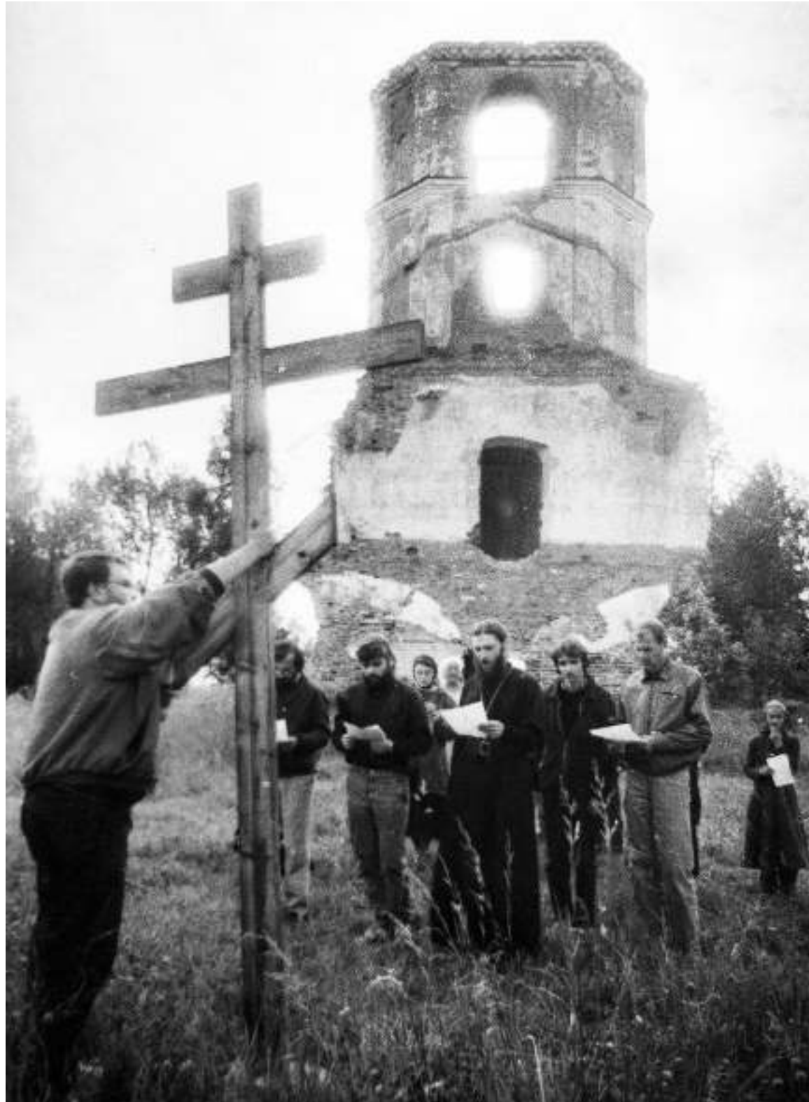
Молитва у Креста о возобновлении Дымской обители, 6 июля 1994 г.