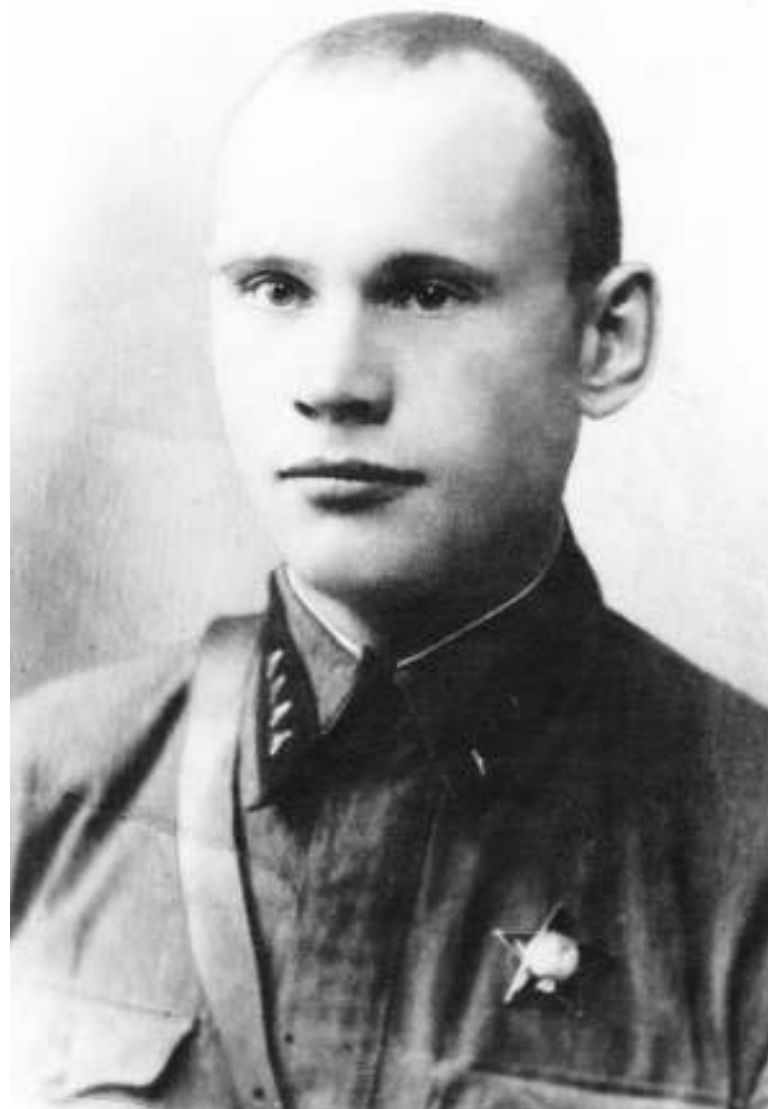
После вручения Ордена. 1940 год.

В годы смертельной опасности для нашей Родины Вы проявили мужество, отвагу, презрение к смерти и непреклонную волю к победе. Ваши боевые подвиги и тяжкий воинский труд в Великой Отечественной войне, сегодня в день 30-летия победы с глубокой благодарностью отмечают все советским народом.