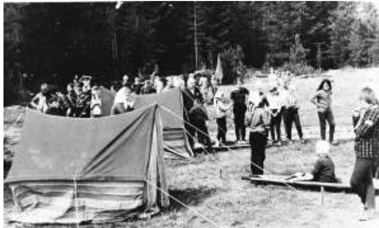
Занятия по Г.О. в лагере «Восток»

Сердечно благодарю моих единомышленников, задействованных в сборе инфор-