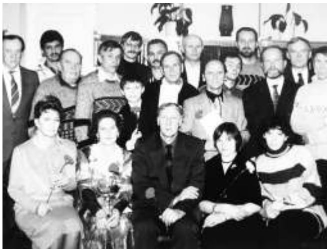
1996г. Презентация сборника стихов «Родниковый говор».