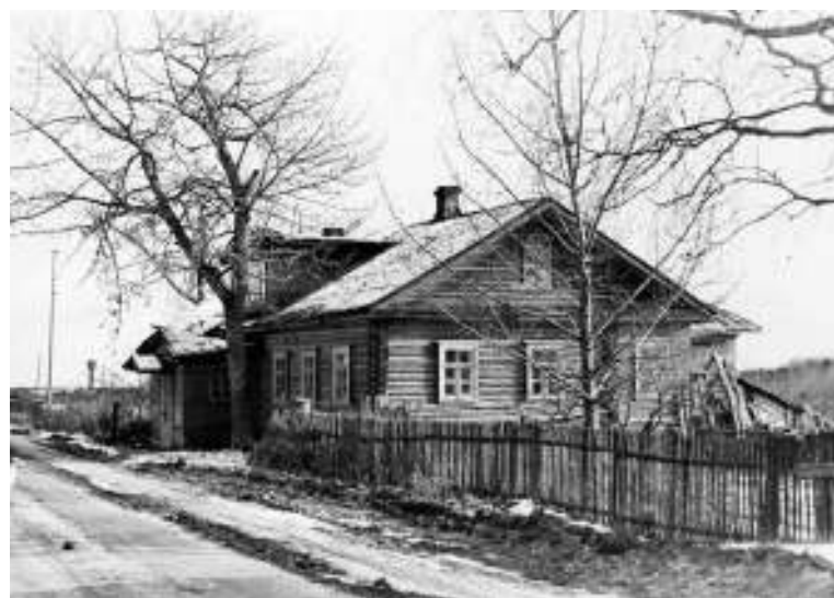
Бывший дом священника в селе Сенно. Фото 1982 года.