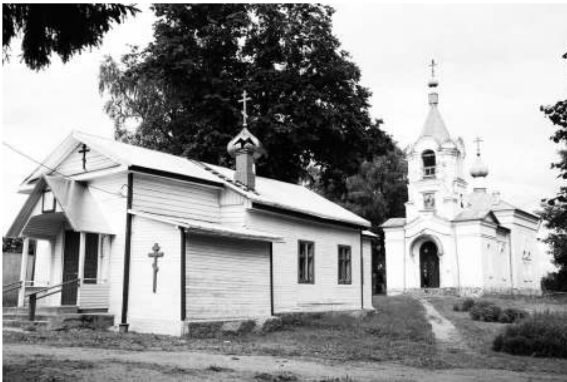
Церкви Сенновского Свято-Троицкого скита. Слева во имя св. Флора и Лавра, справа Троицкая церковь.