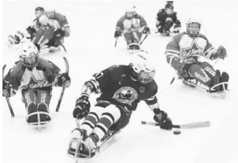
Игра в разгаре