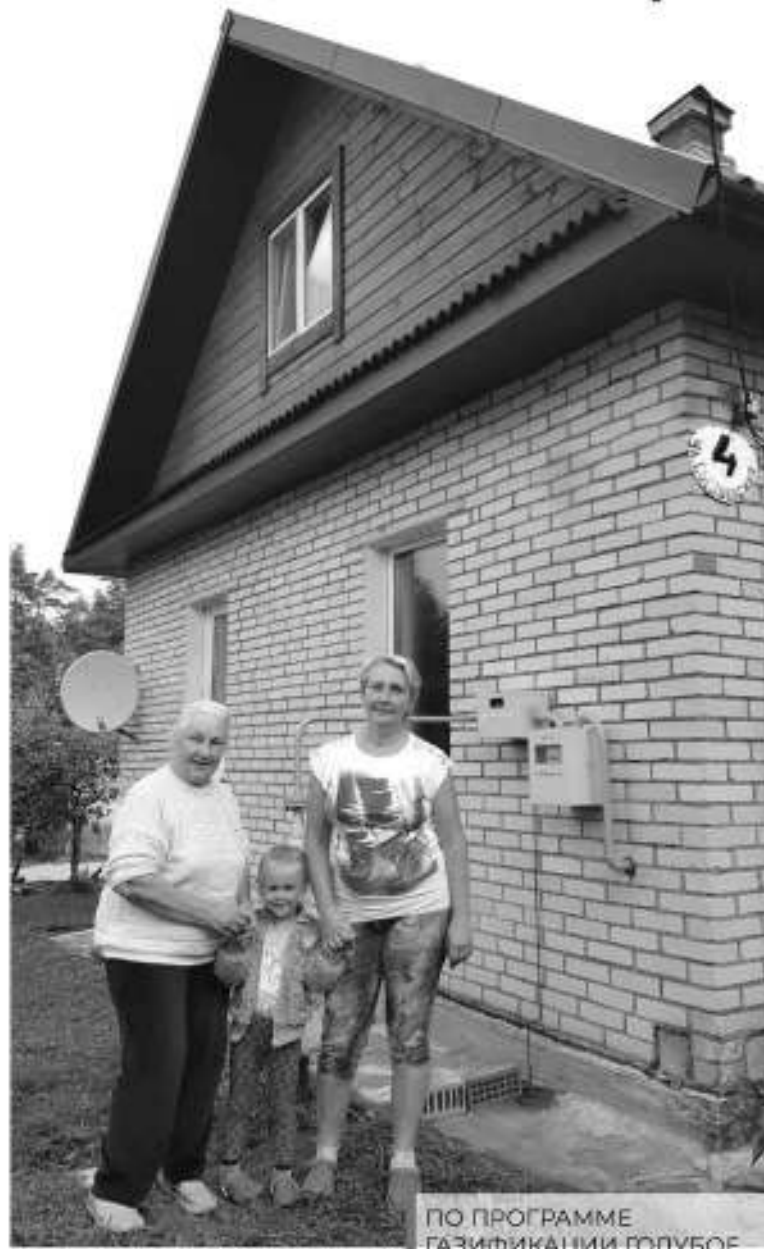
ПО ПРОГРАММЕ ГАЗИФИКАЦИИ ГОЛУБОЕ ТОПЛИВО ПОДВОДЯТ К ДОМАМ, НАХОДЯЩИМСЯ В ПРЕДЕЛАХ НАСЕЛЕННЫХ ПУНКТОВ.