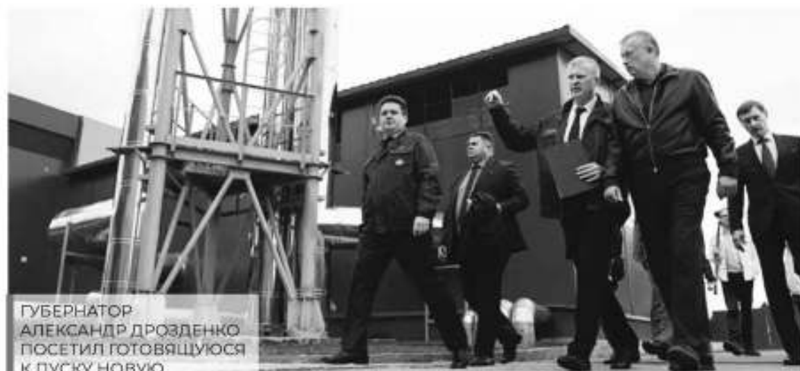
ГУБЕРНАТОР АЛЕКСАНДР ДРОЗДЕНКО ПОСЕТИЛ ГОТОВЯЩУЮСЯ К ПУСКУ НОВУЮ ГАЗОВУЮ КОТЕЛЬНОЮ В ПРИОЗЕРСКЕ.

Увидев желание и возможности субъекта, руководство «Газпрома» приняло решение увеличить финансирование: вложения составят 31,1 млрд рублей. Сумма уча-