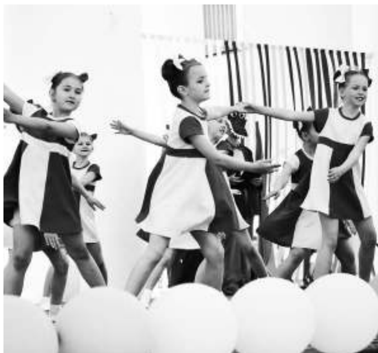
День защиты детей 1 июня 2019 года