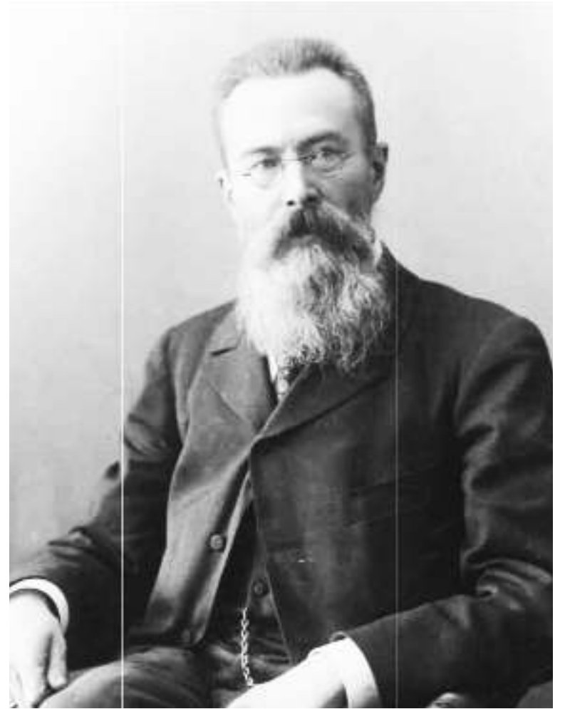
Николай Андреевич Римский-Корсаков

Закончив в 1862 году Морской корпус, гардемарин Римский-Корсаков отправился в кругосветное плавание, продолжавшееся три года. Позже любовь к морю, восхищение его красотой вдохновили композитора на создание таких оперных шедевров, как «Садко» и «Сказка о царе Салтане».