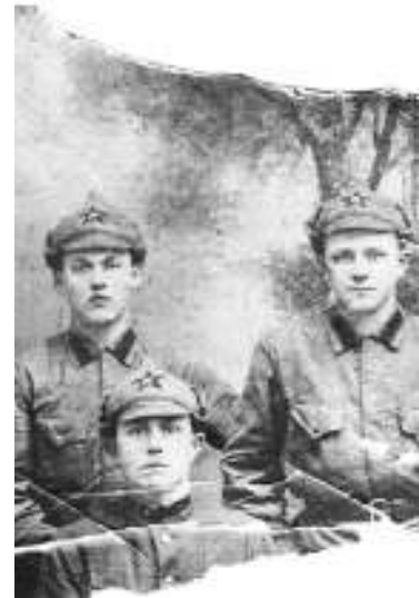
Из альбома Г.С. Новожиловой, фото отца с боевыми товарищами