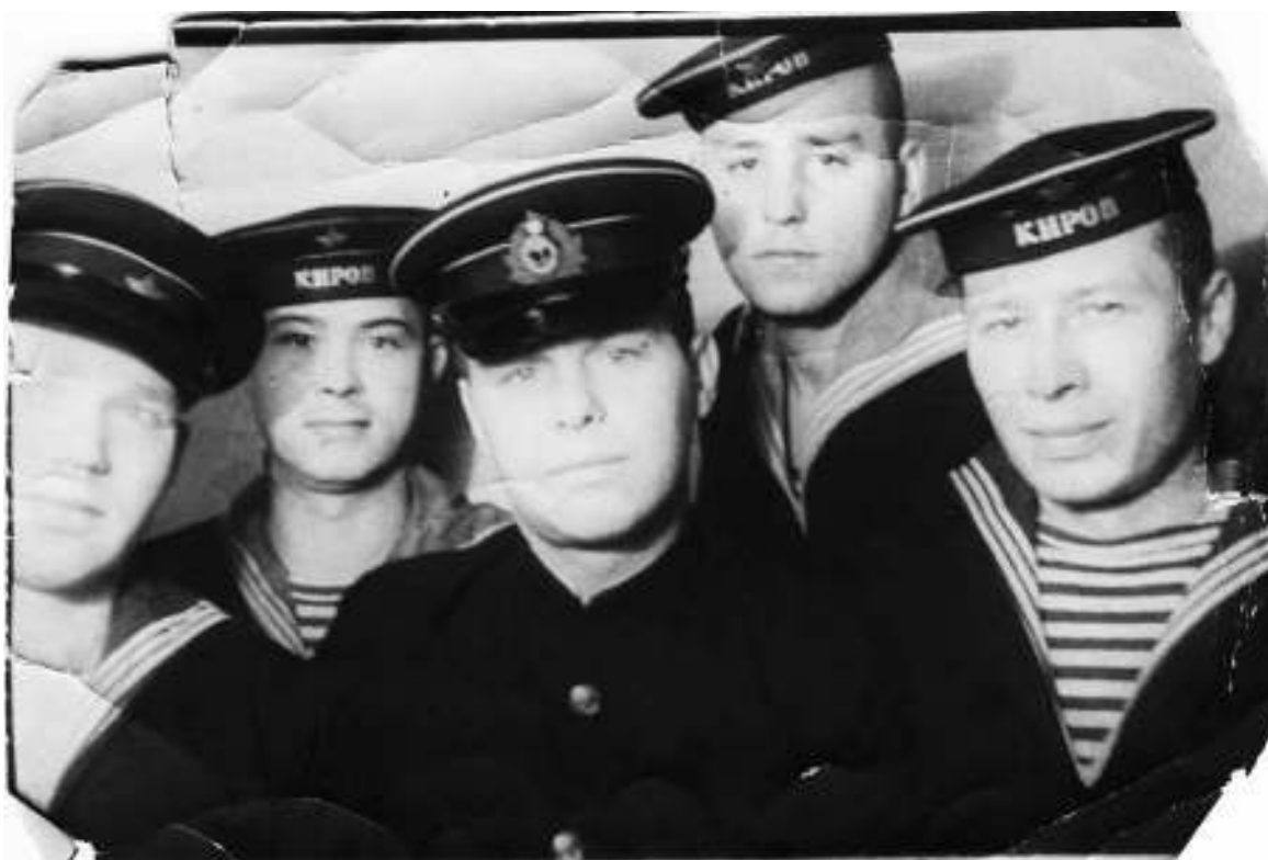
Капитан с матросами легендарного крейсера «Киров» КБФ