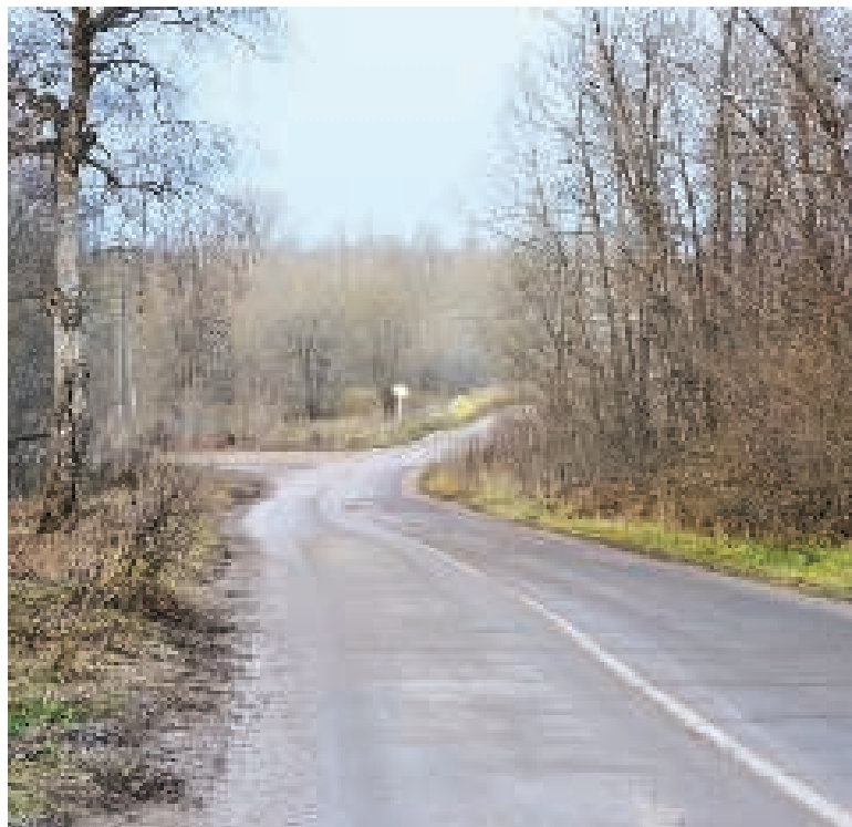
Дорога на Пикалевское городское кладбище.

Данный очерк посвящен истории местности, в которой в настоящее время расположено Пикалевское городское кладбище.