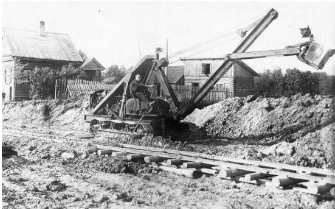
Строительство подъездных путей цементного завода в окрестностях Ариново. 1938 г.

Можно перечислять детские изобретения бесконечно, поэтому День детских изобретений празднует весь мир. Проходят многочисленные демонстрации новых изобретений, конкурсы, награждения. Всегда задорный смех, шутки, музыка, потому что изобретать – это естественное состояние всех детей!