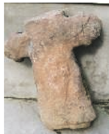
Каменный крест из окрестностей Ариново