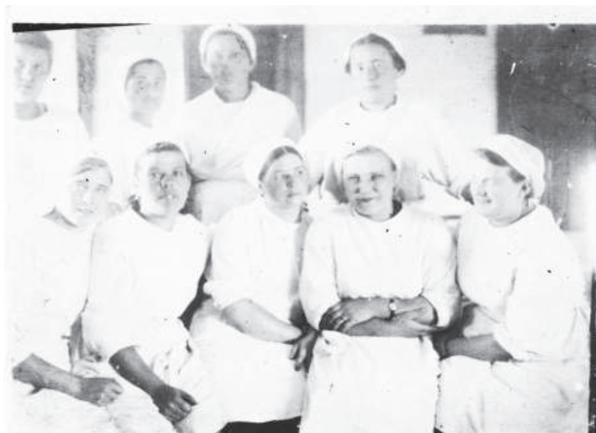
Коллектив ЭГ № 2019. Фото военных лет