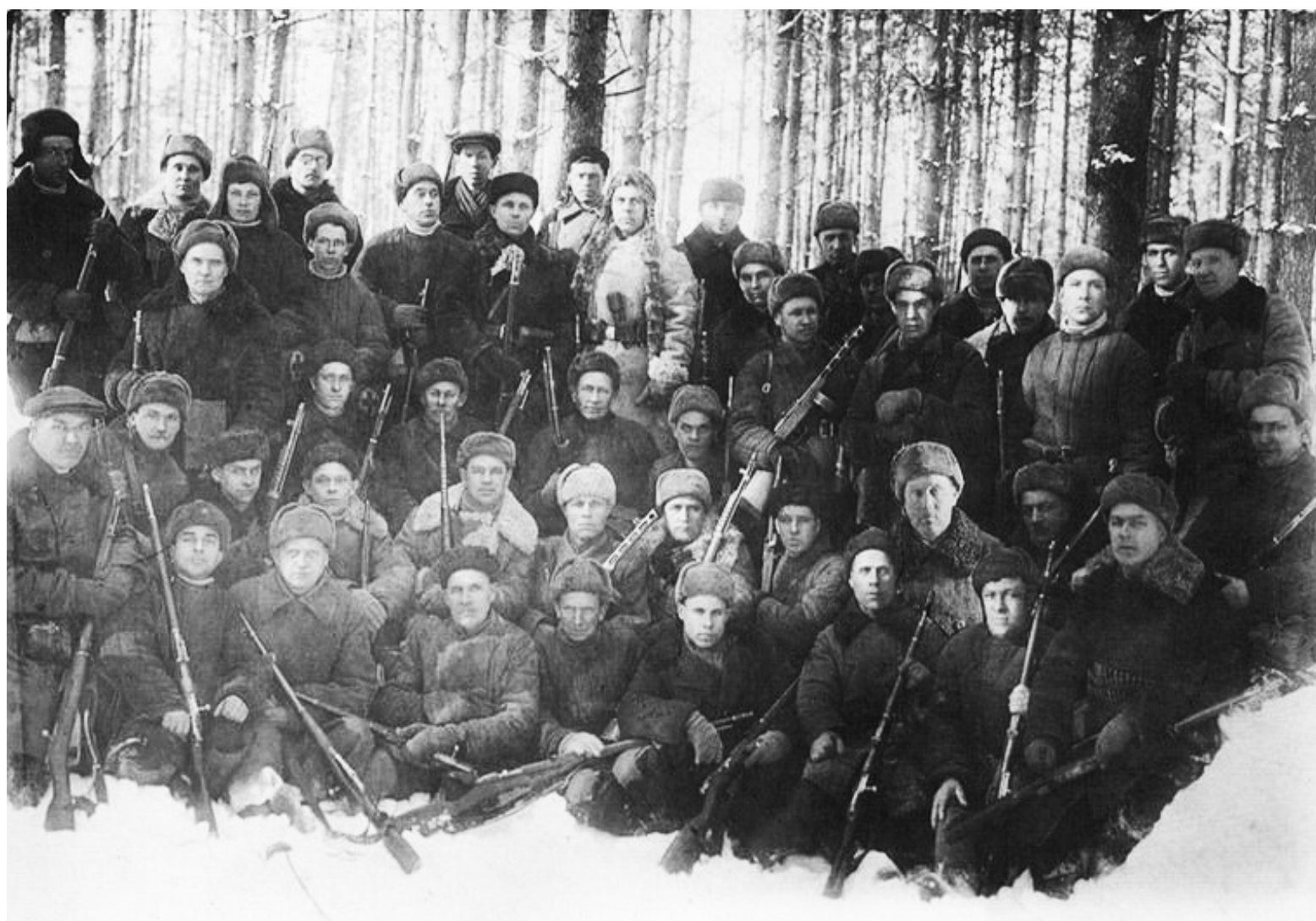
Партизанская бригада имени Германа