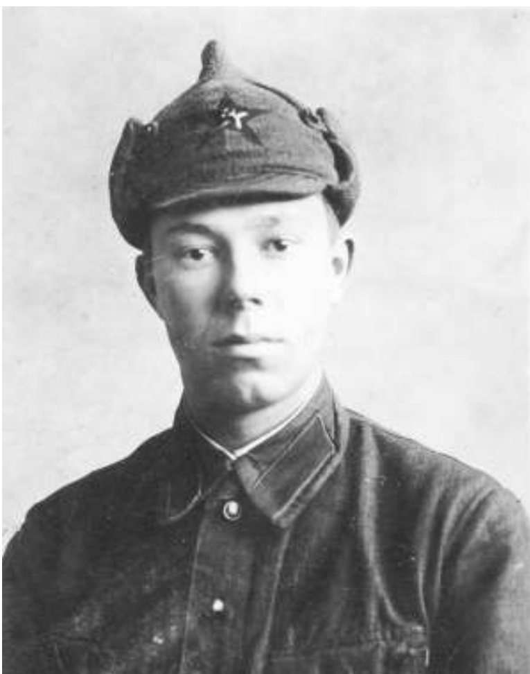
Василий, 11 декабря 1939 год