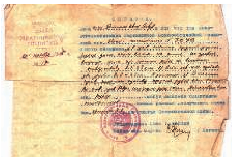
Справка военно-врачебной комиссии при ЭГ № 3646 города Берлина от 20.11.45 года