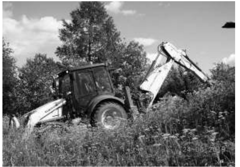
Обследование места предполагаемого захоронения, 24 июня 2019 года

Тем не менее была проделана большая важная работа. Хотелось бы поблагодарить всех неравнодушных людей, которые оказыва-