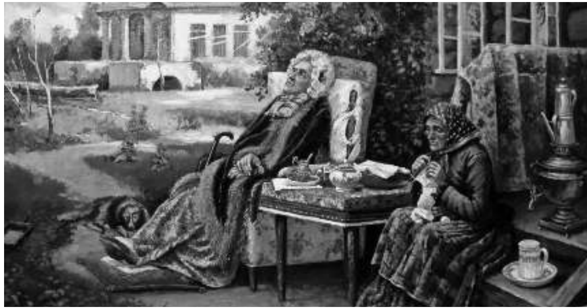
В.М. Максимов Всё в прошлом . 1889 г. ГТГ

60 лет в бывшей усадьбе не проживали. Возможно, в ней в данный период обитали бывшие дворяне люди князей Мышецких, которые не сумели устроиться в новых реалиях жизни после отмены крепостного права.