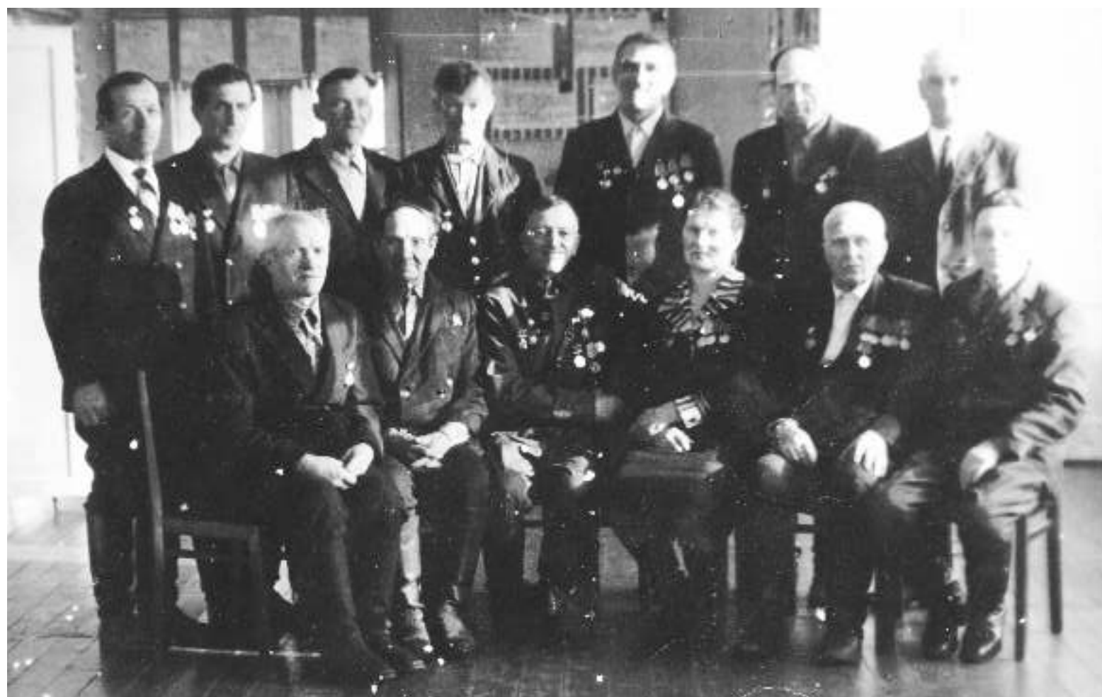
Счастливы! Они вернулись домой!!!