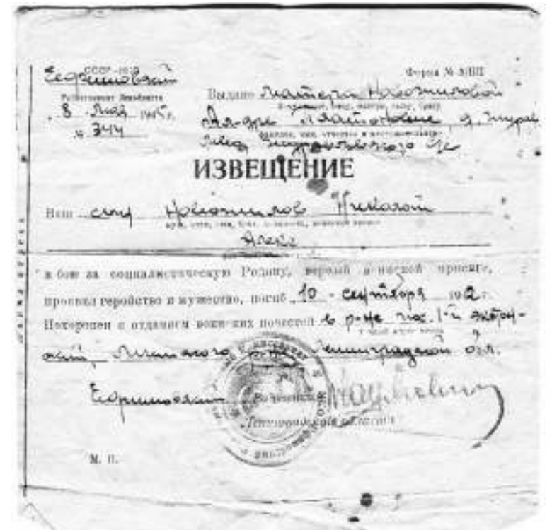
Похоронка на Николая Новожилова