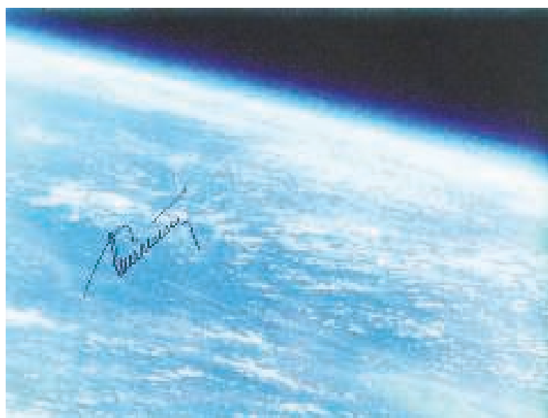
2. Снимок Земли с автографом Германа Титова 1961 год.