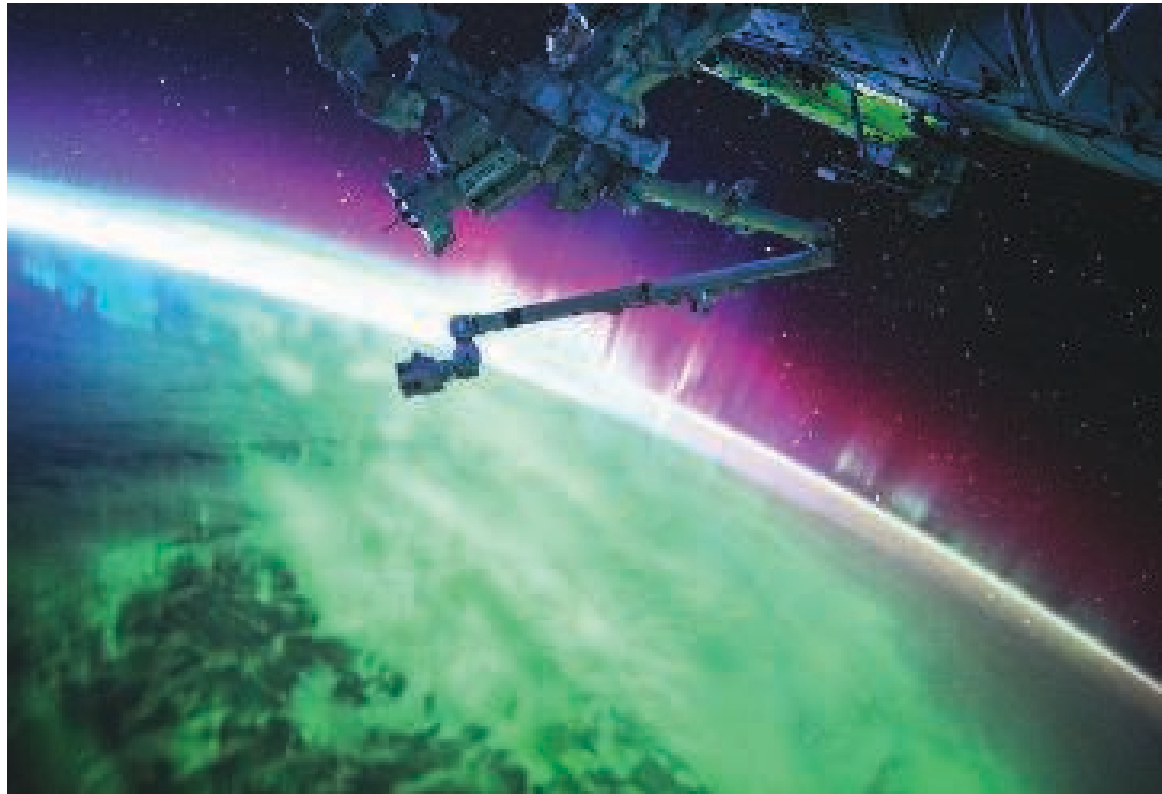
Полярное сияние над Землёй с борта МКС. 2015 год.

В последние годы космонавты в скафандрах, работая за бортом, стали понемногу чистить иллюминаторы. И такая чистка