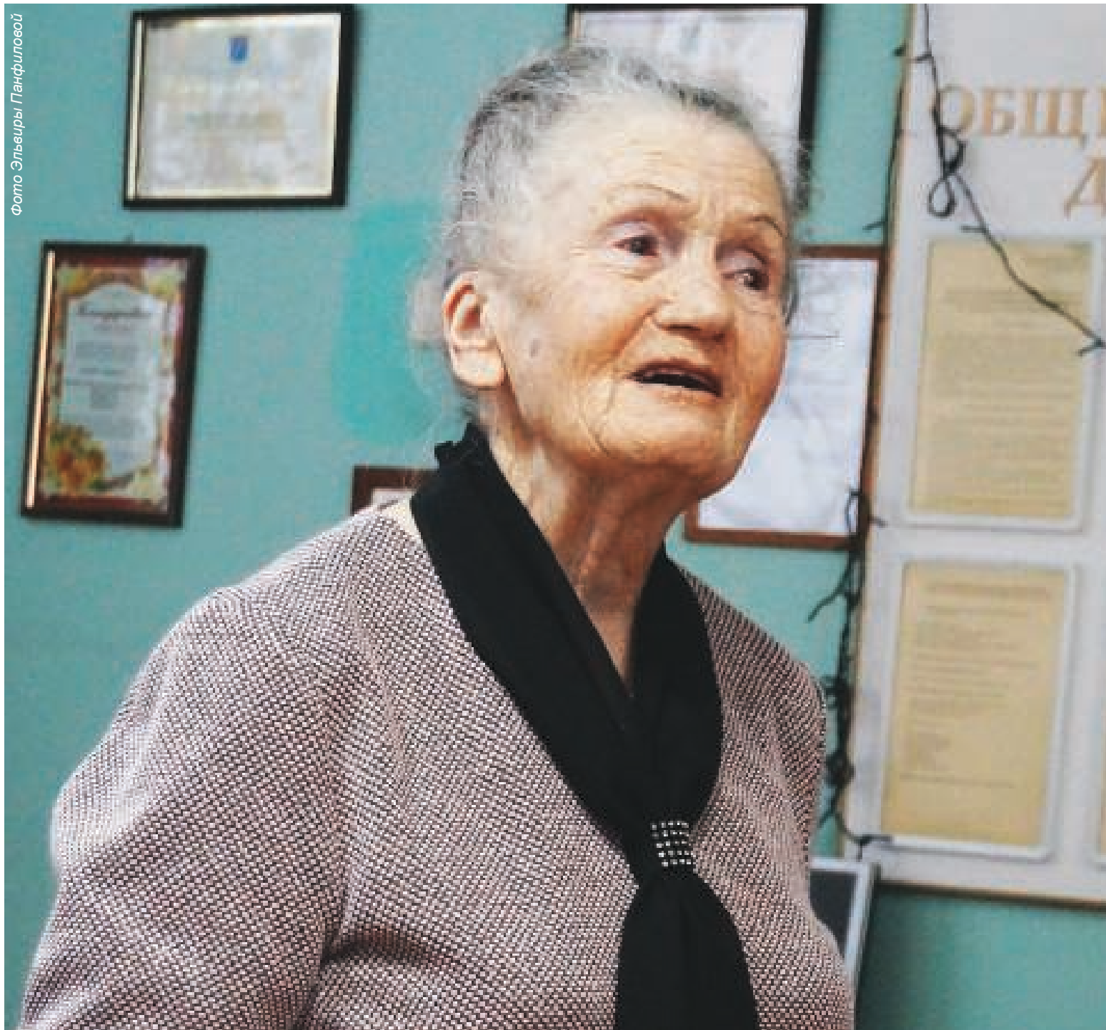
О встрече с бывшими малолетними узниками фашистских концлагерей и жителями блокадного Ленинграда читайте на странице 8