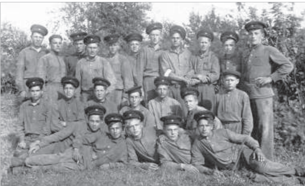
Группа учащихся ремесленного училища (Из фонда Пикалёвского краеведческого музея)