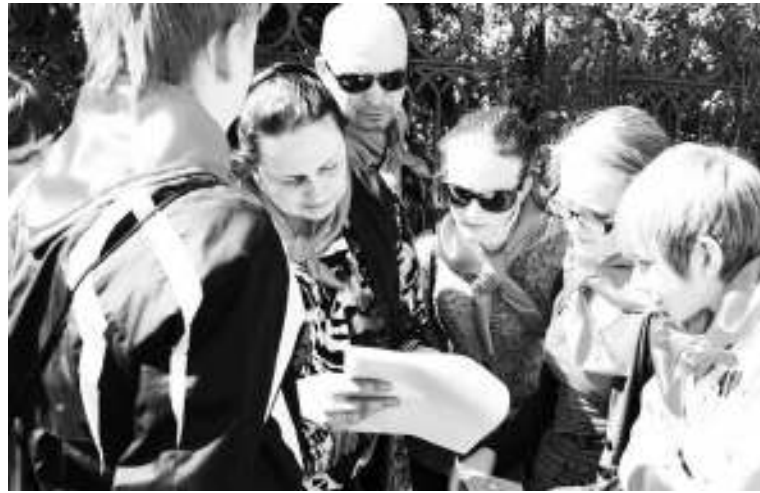
Квест Сомино – малый Петербург

Цель гражданско-патриотического воспитания в нашей школе – развитие в личности высокой